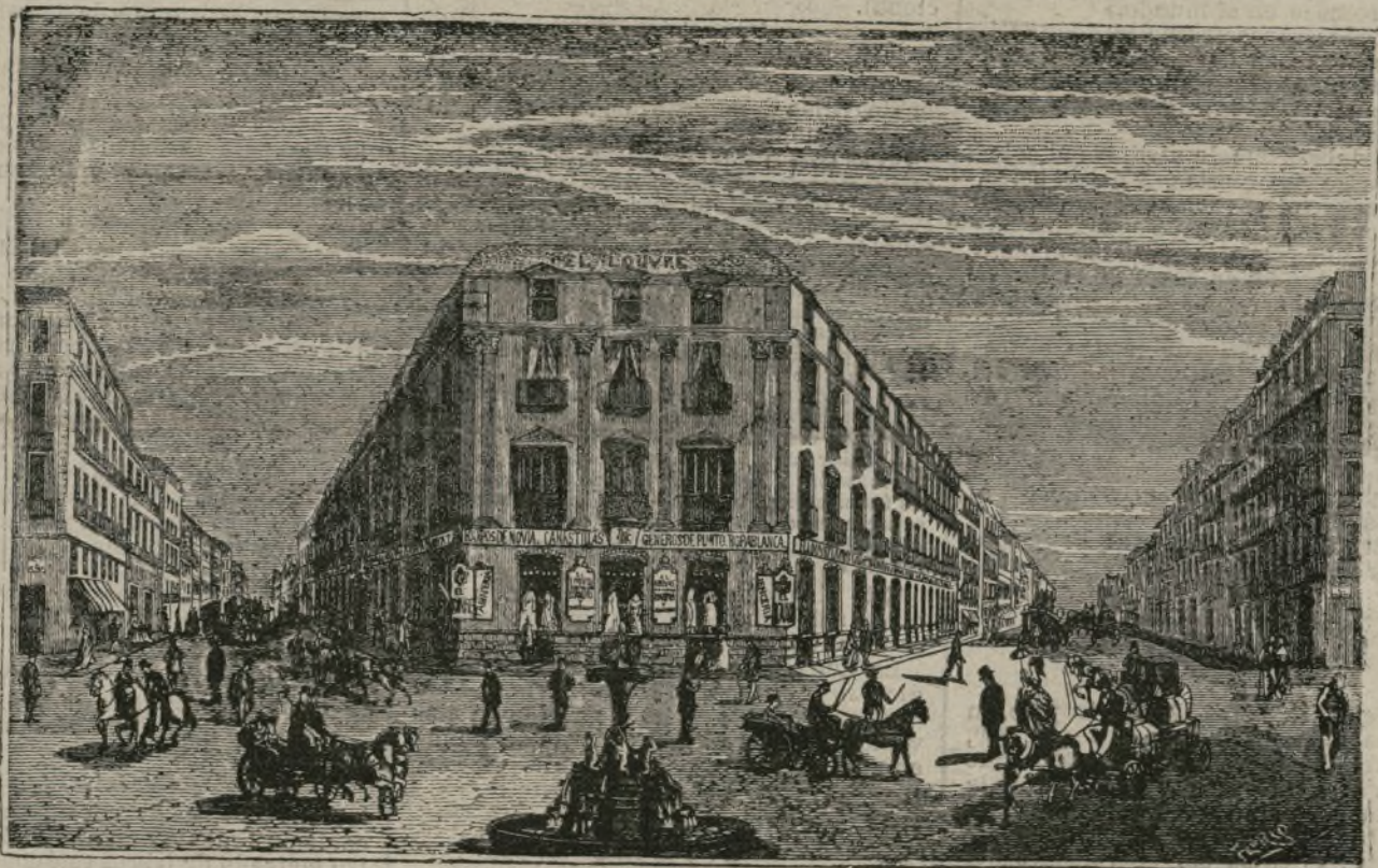
La antigua Red de San Luis.

De los generales mas famosos de los últimos tiempos, Narvaez fué cuatro veces ministro, desempeñando la cartera en las cuatro veces, cuatro años y tres meses. O'Donnell, tres veces, y en ellas un total de siete años y siete meses. Serrano otras tres veces, no llegando en todas ellas a un año, y Prim una sola vez por espacio de dos años.