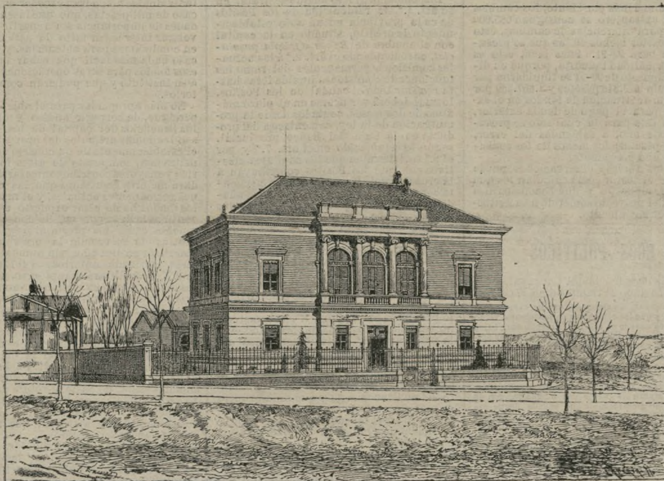
Laboratorio Gómez Pardo.

Parece, pues, que pueden obtenerse imanes de potencia magnética muy constante, exponiéndolos, durante algún tiempo, a la temperatura del agua hirviendo e imantándolos enseguida definitivamente.