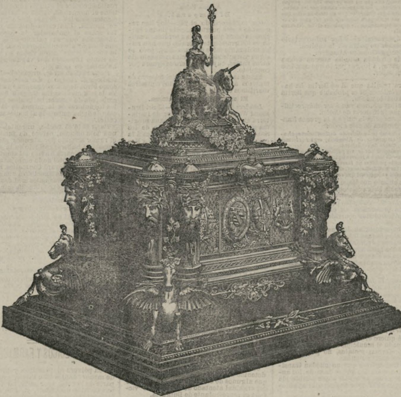
Un cofre artístico.

Para comprender la importancia de la industria de Birmingham (Inglaterra), baste saber que las diferentes fábricas que existen en dicha capital, producen en una semana lo siguiente: 14.000.000 de plumas de acero, 6.000 camisas de hierro, 7.000 fusiles, 300.000.000 de clavos, 100.000.000 de botones, 1.000 sillas de hierro, 5.000.000 de monedas de cobre y bronce, seis toneladas de utensilios de papel prensado, mas de 3.000 joyas, 4.000 millas de alambre de hierro y acero, 10 toneladas de alfileres, 150.000 gruesas de tornillos de madera, 600 toneladas de tornillos y tapones de hierro, 50 toneladas de goznes de hierro fundido, 350 millas de cerillas, 40 toneladas de metal refinado, 40 toneladas de níquel y 8.500 fuelles.