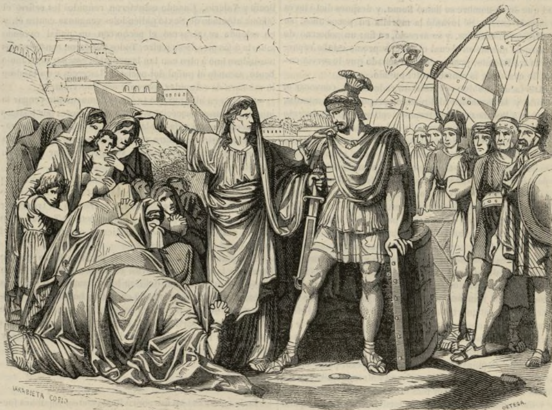
Sálvese Roma y perezca vuestro hijo.