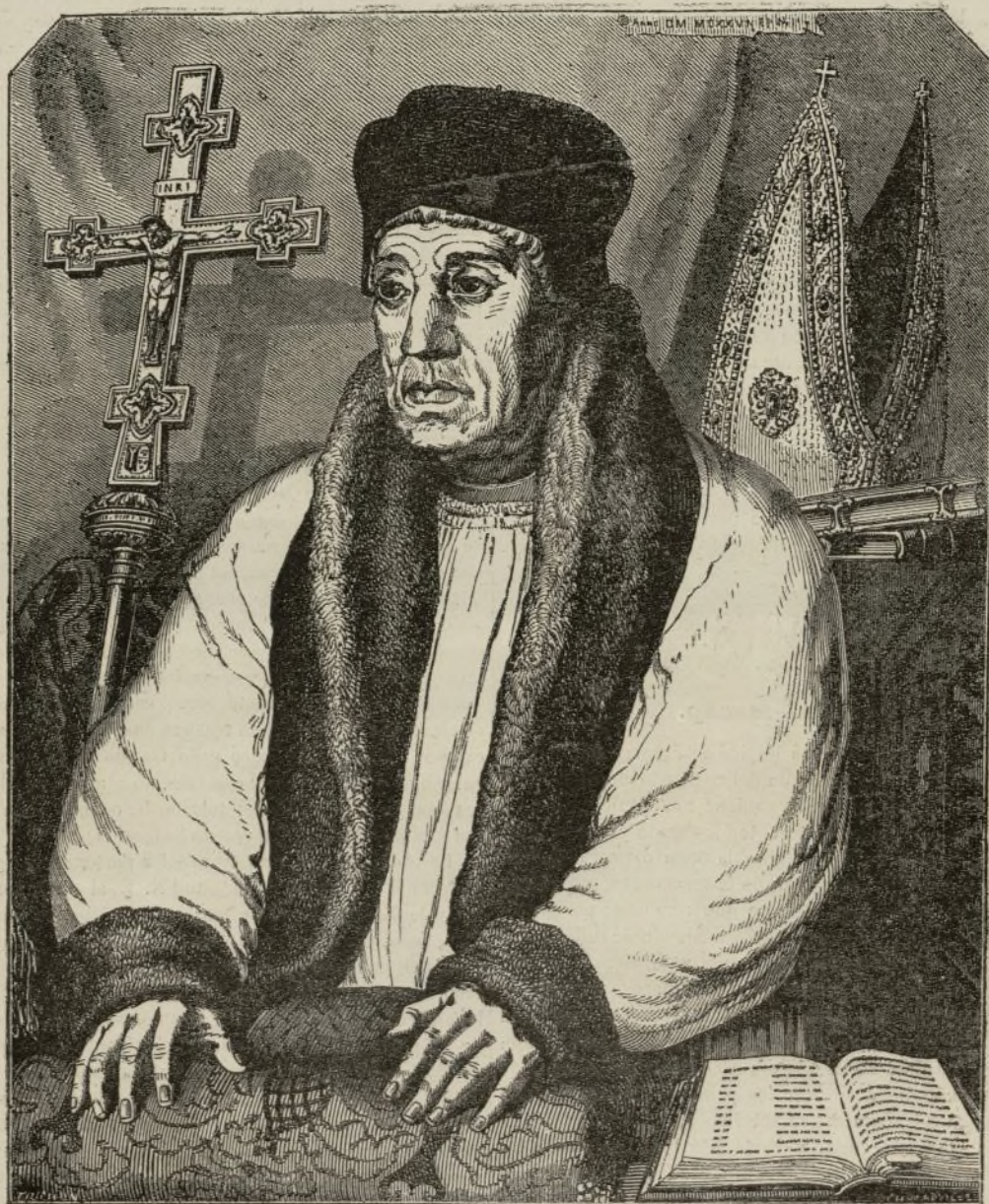
Retrato del arzobispo de Cantorbery, por Holbein.

El retrato que precede, cuyo original existe en el museo del Louvre en Paris, es una obra maestra entre las obras maestras del célebre artista Juan Holbein. Jamás la naturaleza se estudió mas profundamente, ni se reprodujo la vida con mas ilusion. Todos los detalles de esa cabeza de anciano,