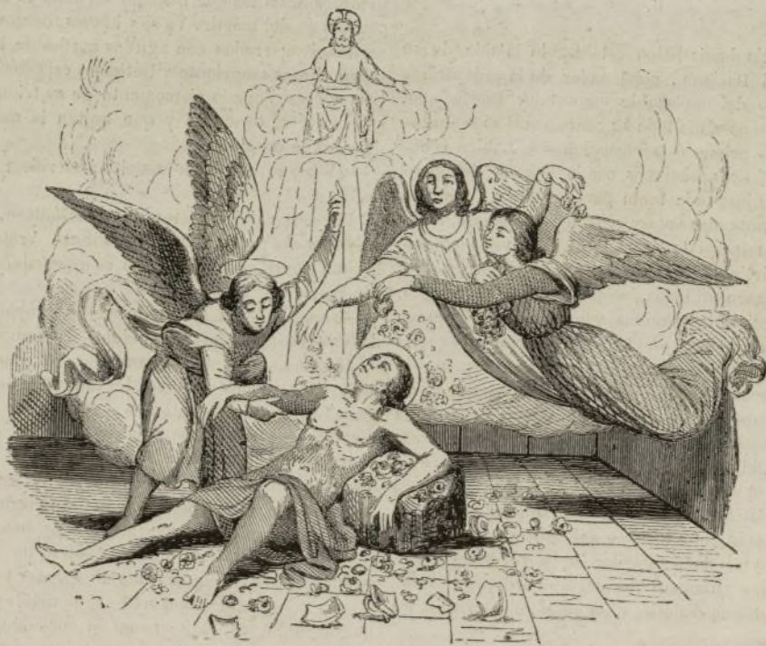
Los ángeles consuelan á San Vicente en su martirio.