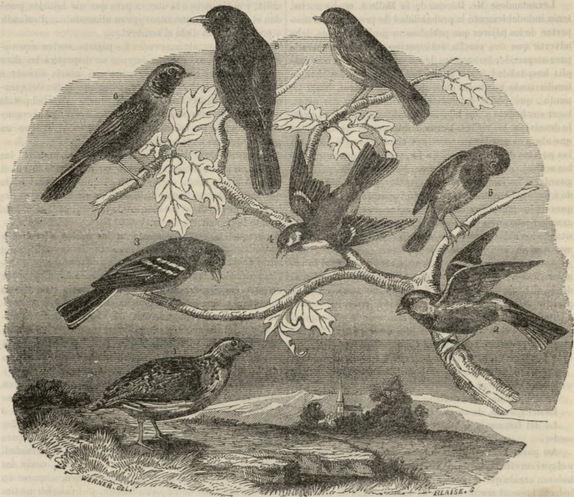
1 Codorniz.—2 Gorrión.—3 Pinzón.—4 Fringal.—5 Curruca de cabeza negra.—6 Ruiseñor. 7 Pulioto.—8 Mirló.

¿Quién puede contestar á esa pregunta? ¿Sois por ventura vosotros, viajeros infatigables, que semejantes al judío errante marcháis noche y día y todavía estais andando? No: en vuestras correrías por el mundo, gozais de los alegres trinos que os envía el ave de Dios, y no os ocupais de mas.