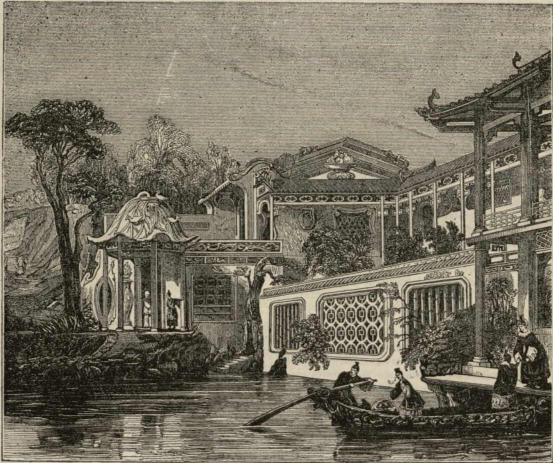
Paisaje chino de fantasia, segun las descripciones de algunos viajeros.

Por la misma época contestaba el emperador con el siguiente enigma, al informe de Seu relativo á la en-