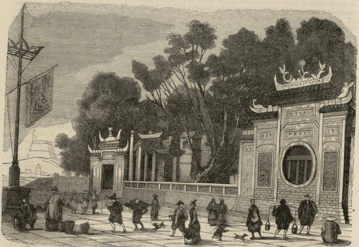
Vista de la gran pagoda llamada del Mar, en Macao.