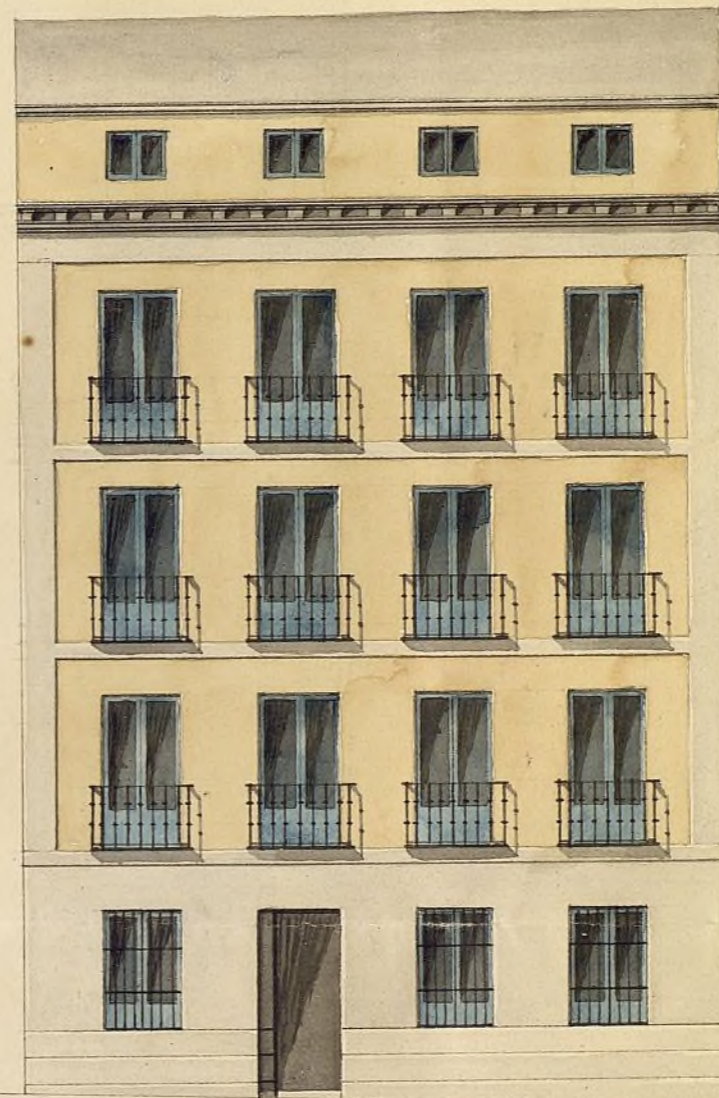
Fachada g. ova Construida en the Calle