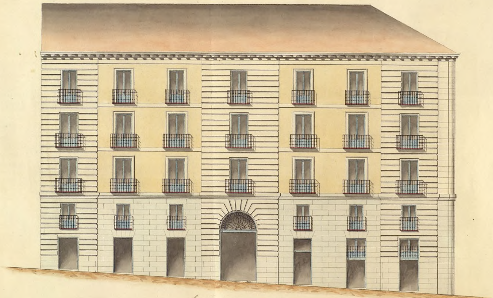
Calle de Segovia.