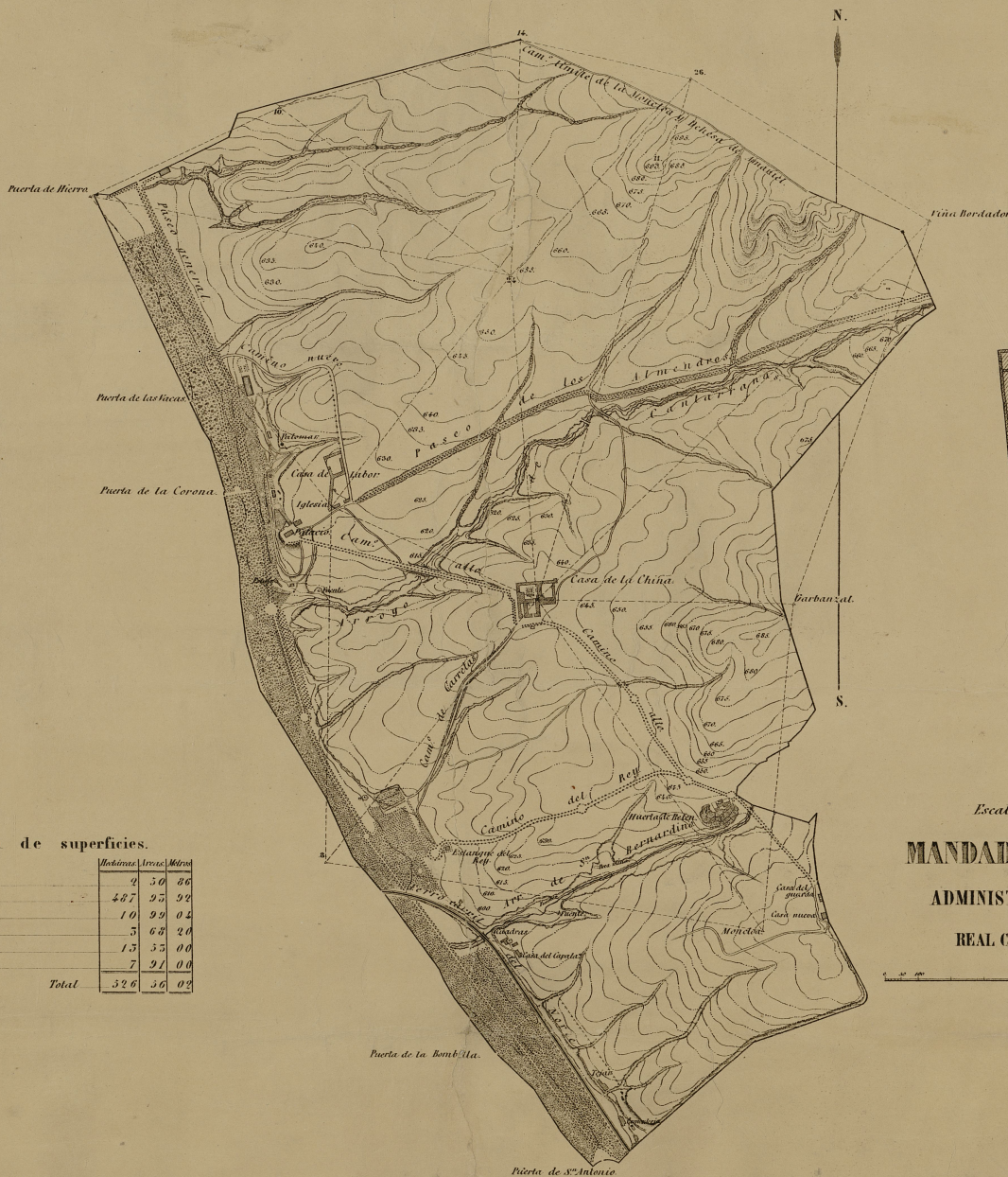
Resumen de superficies.