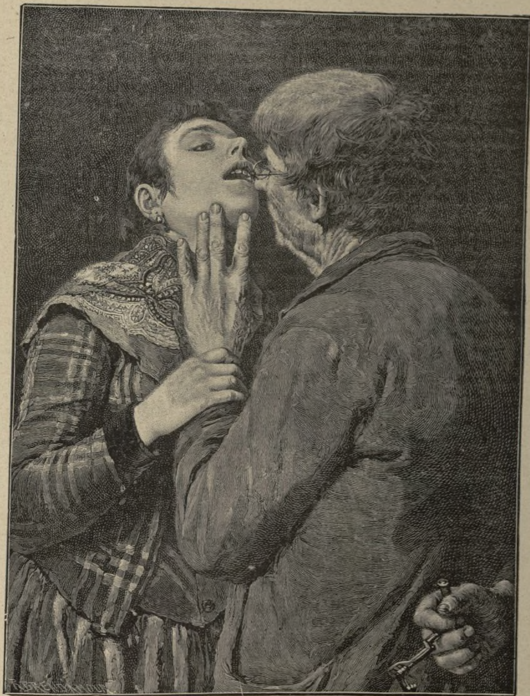
¿LA DEL JUICIO?