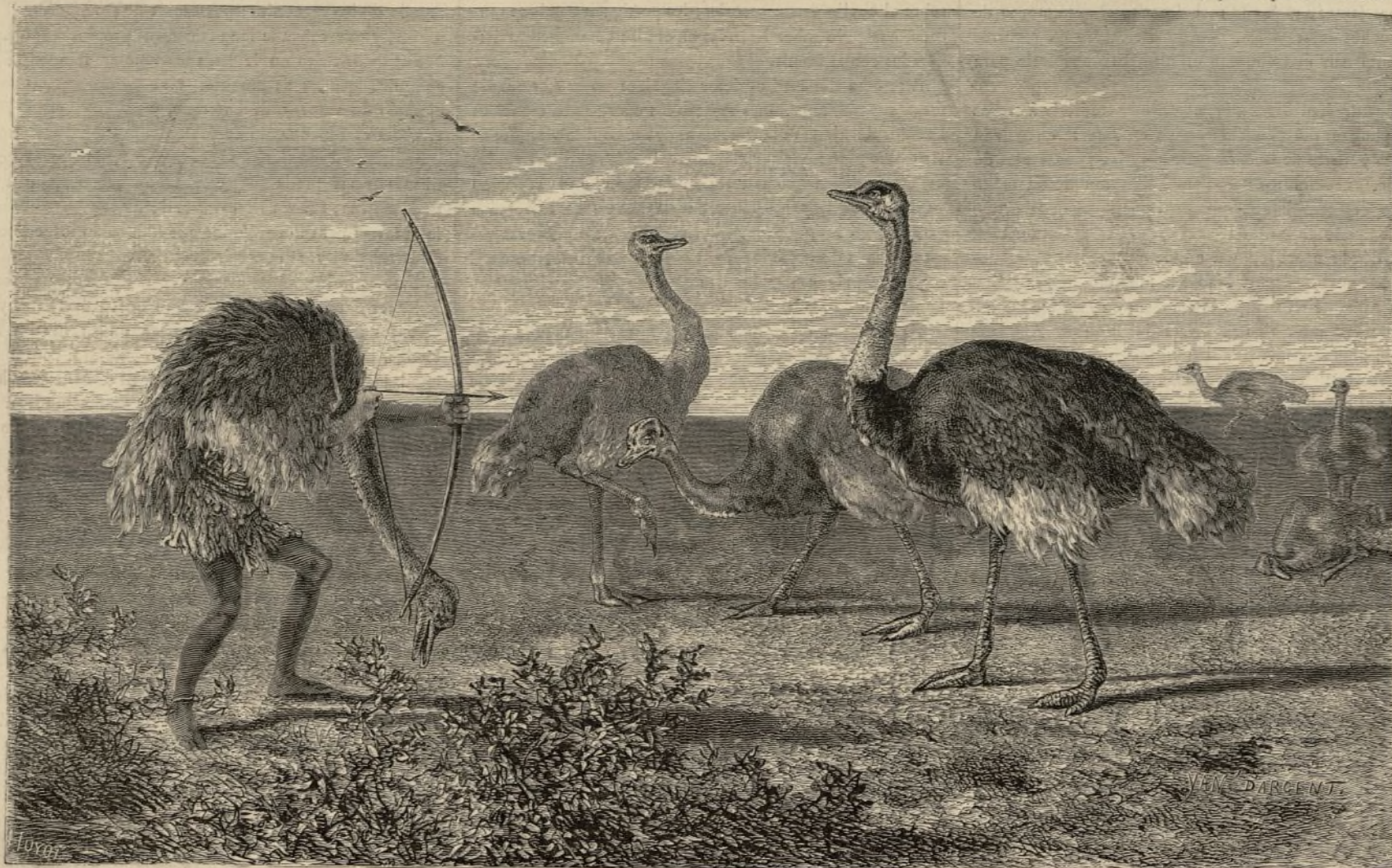
CAZA DE AVESTRUCCES.

Cruzan el aire rápidamente algunos flamencos que van á buscar su presa en las lagunas, encontrándose con el caracara , pájaro de América, que se parece mucho al azor