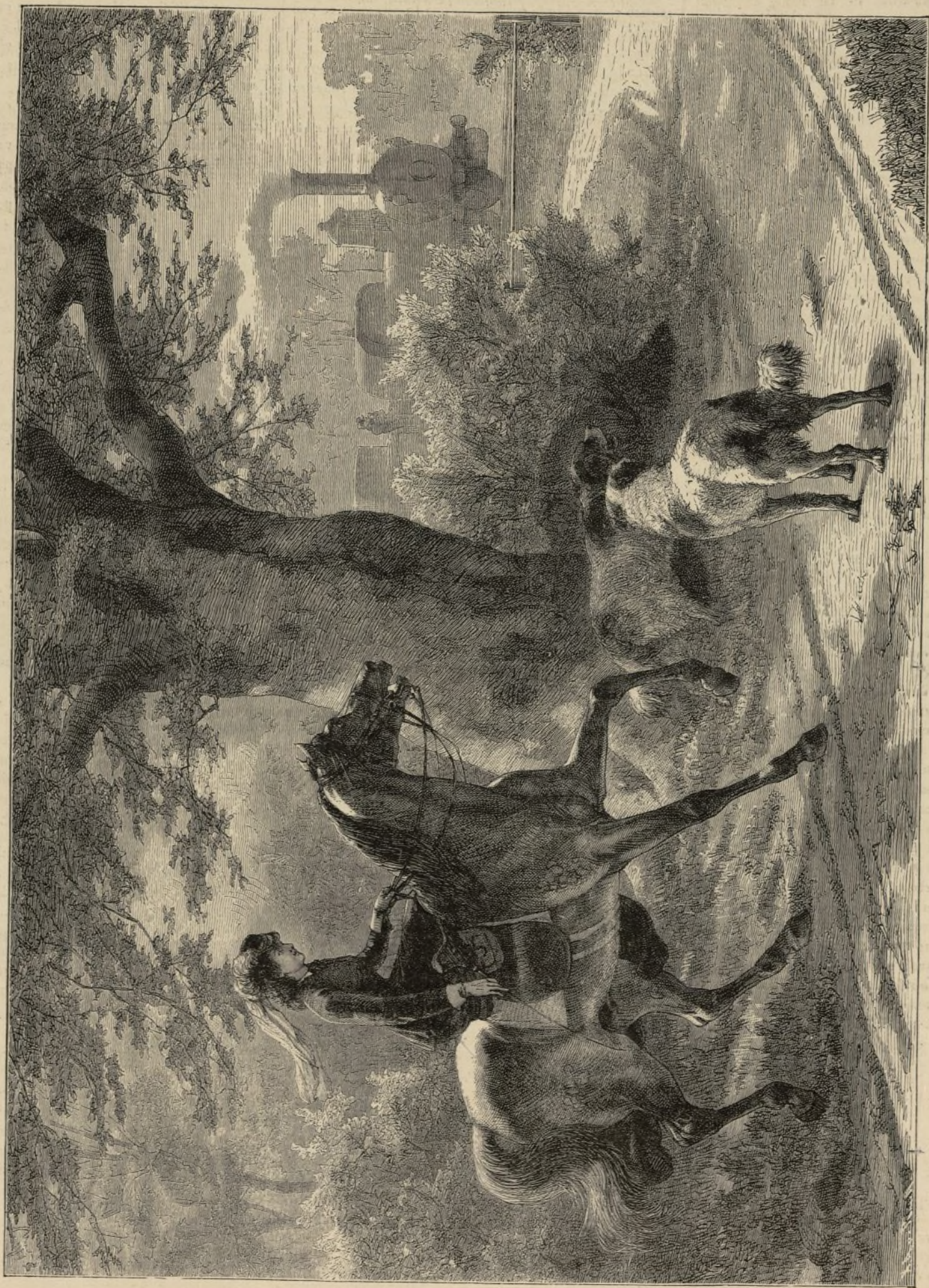
EL AGUARDO DE LA AMAZONA.

pescadores, pues tiene el cuerpo prolongado; las espaldas redondas; la boca adornada de dos barbillones; las aletas dorsal y caudal salpicadas de manchas, lo mismo que sus costados. Su longitud es de unos 20 centímetros.