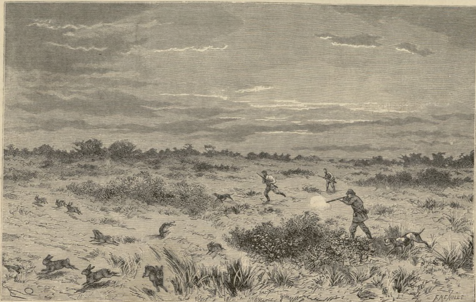
TIRADA DE CONEJOS EN LOS LLANOS DE CAMARGUE.

Las damas, sepultadas en casi perpétua soledad, bajo las