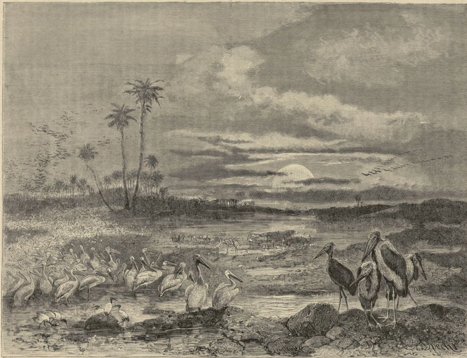
EN EL NILO.—EL PELÍCANO, EL FLAMENCO, EL IBIS Y EL MARABÚ.