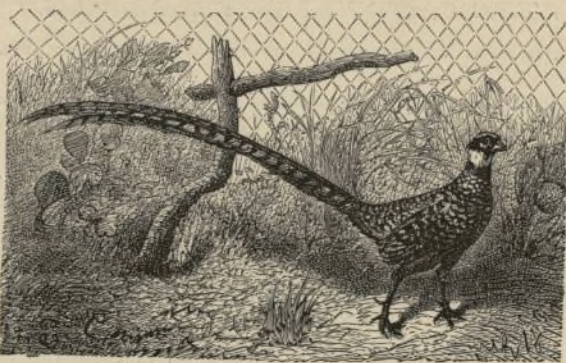
EL DUQUE DE BRABANTE.