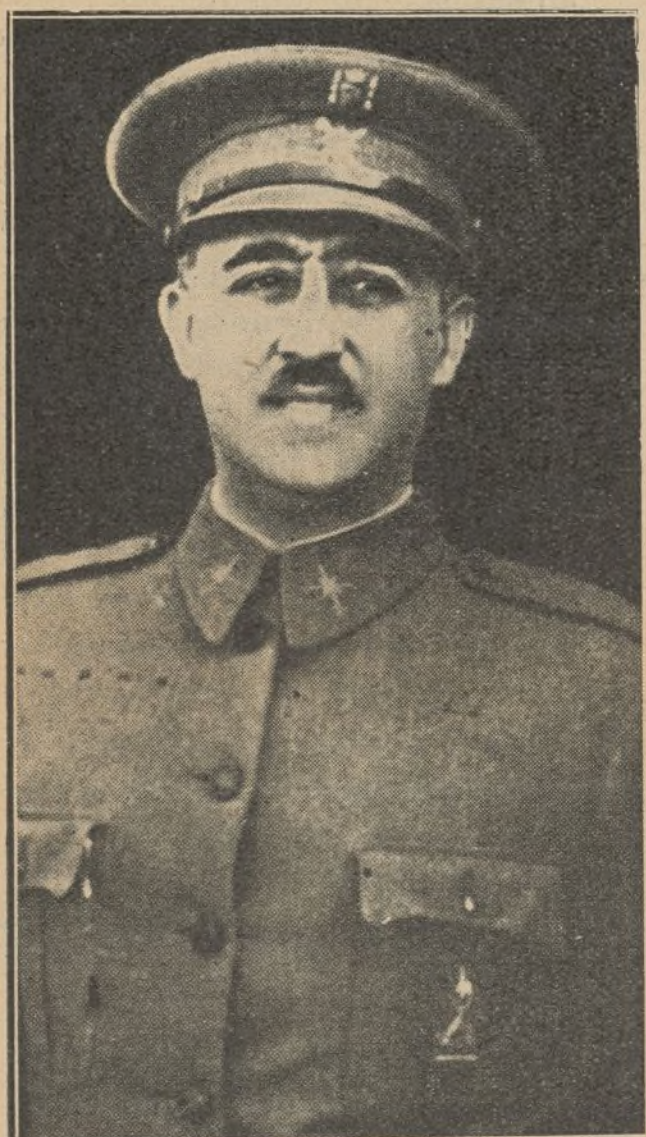
El general Franco, hijo adoptivo de Tenerife

El Cabildo Insular ha tomado el acuerdo de nombrar al glorioso general Franco, ilustre hijo adoptivo de Tenerife.