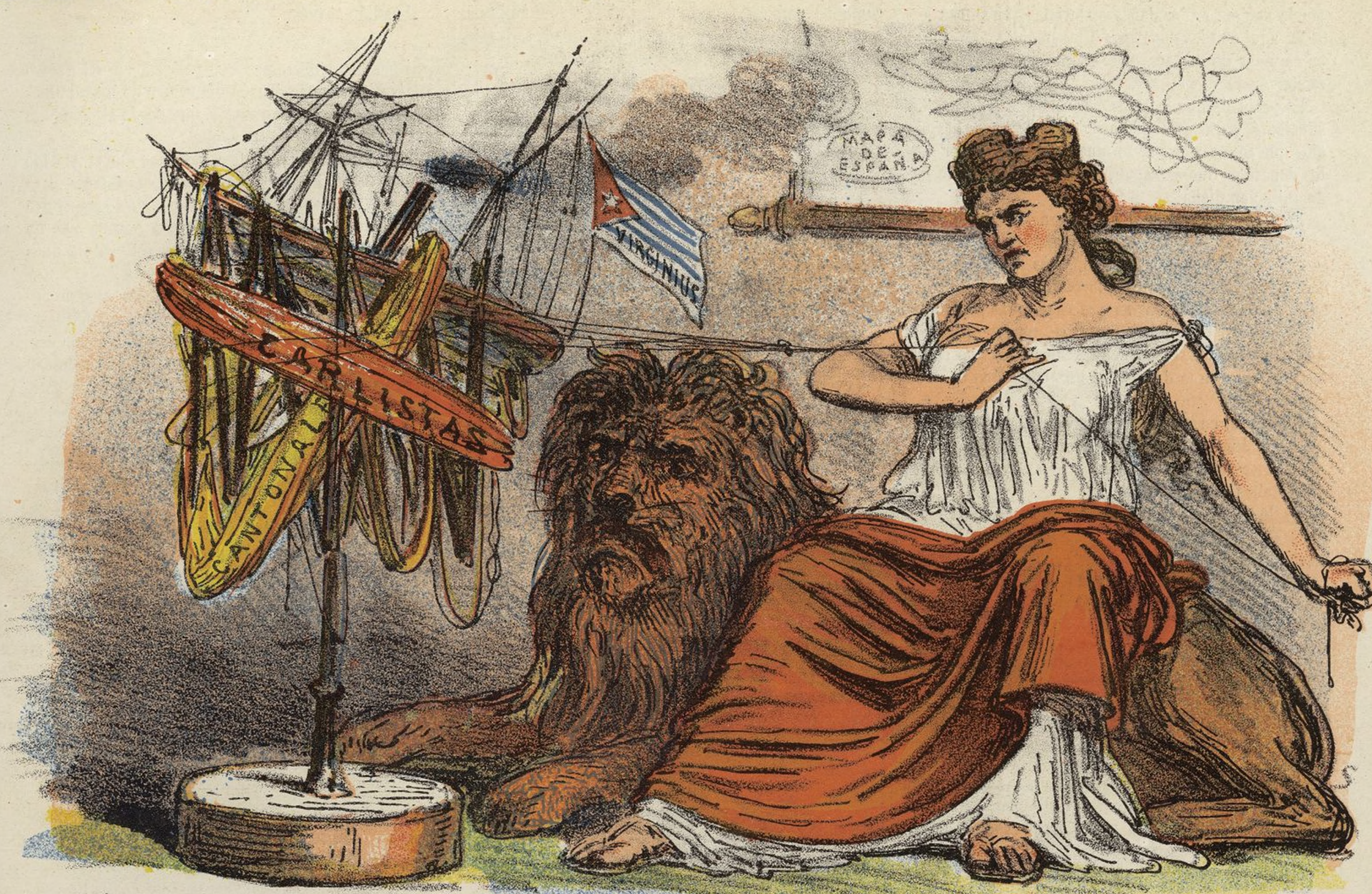
Esto solo nos faltaba para enredar LA MADEJA.