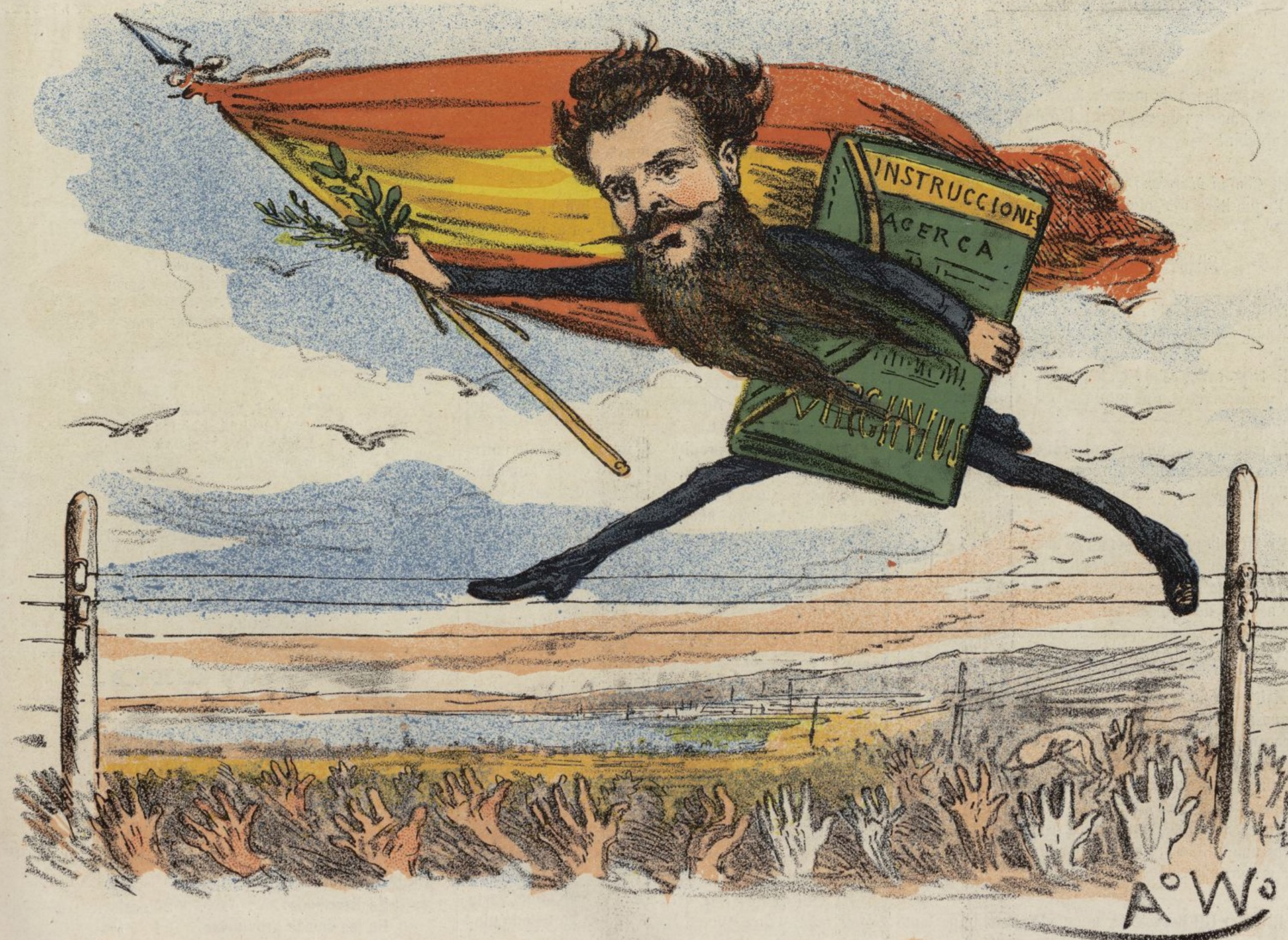
La vuelta deseada.