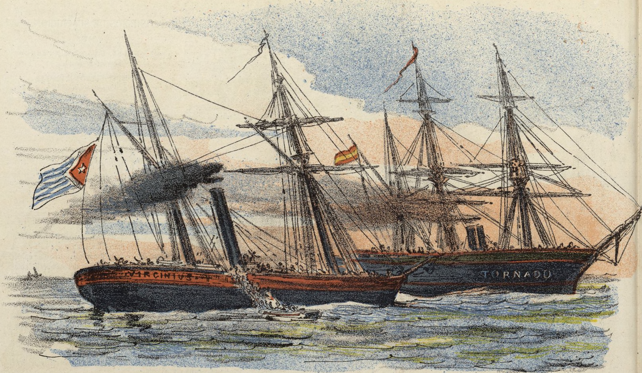
La causa del conflicto.