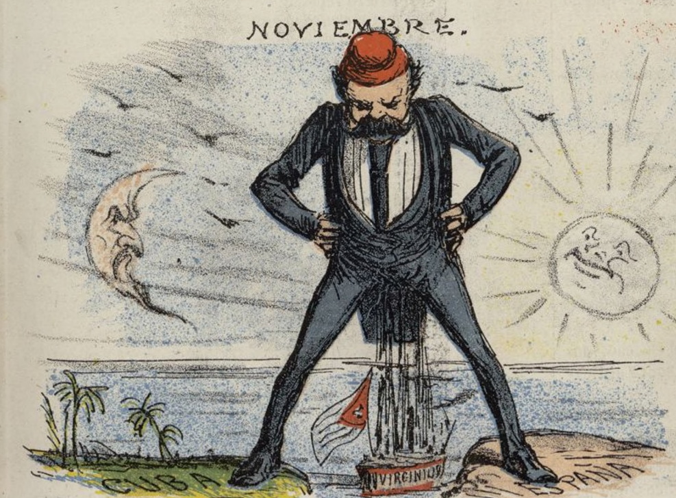
QUESTION - VIRGINIO.