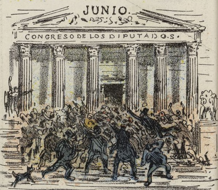
APERTURA DE LA ASAMBLEA.