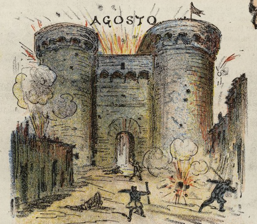
BOMBARDEO DE VALENCIA.