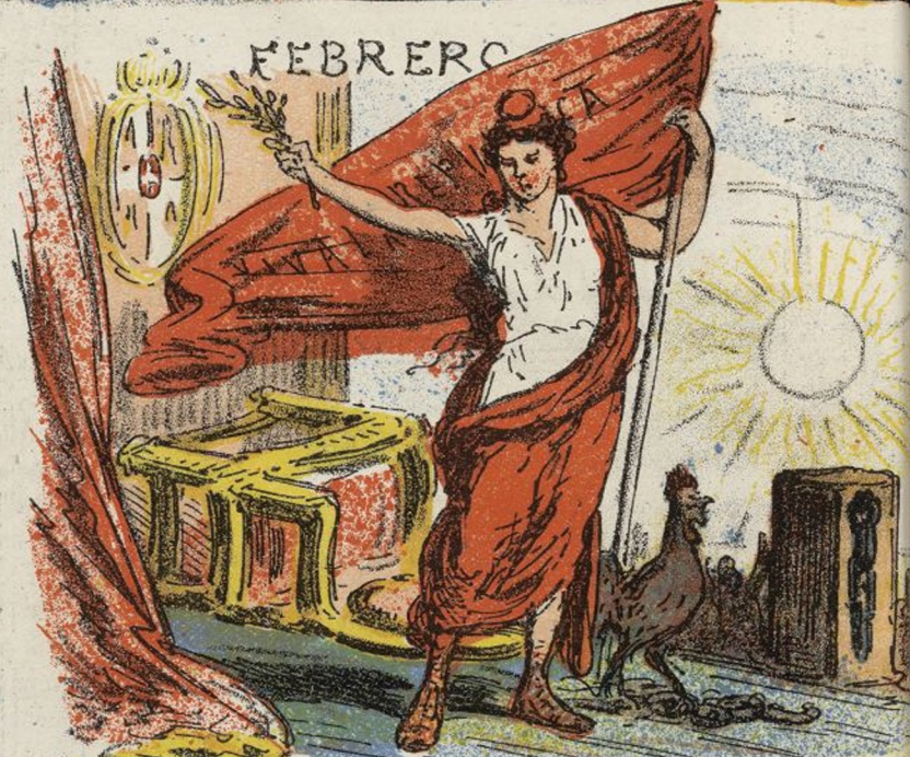
PROCLAMACION DE LA REPUBLICA.