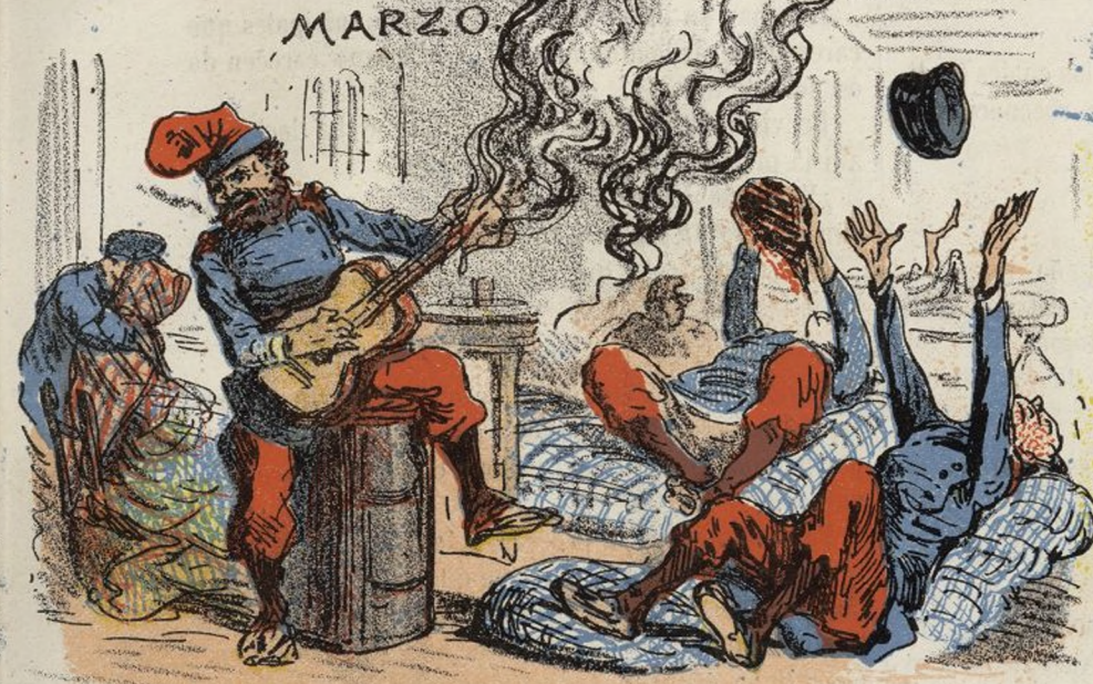
INDISCIPLINA DEL EJERCITO.