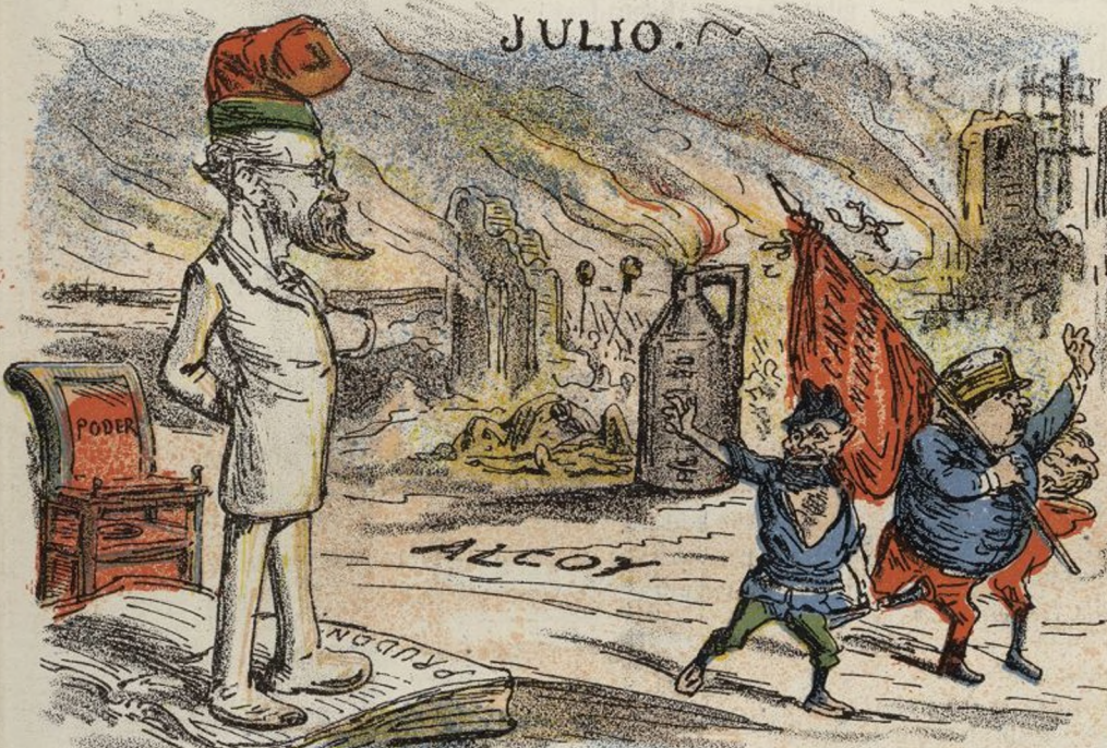
SUCESOS DE ALCOY, Y PROCLAMACION DE CANTONES.