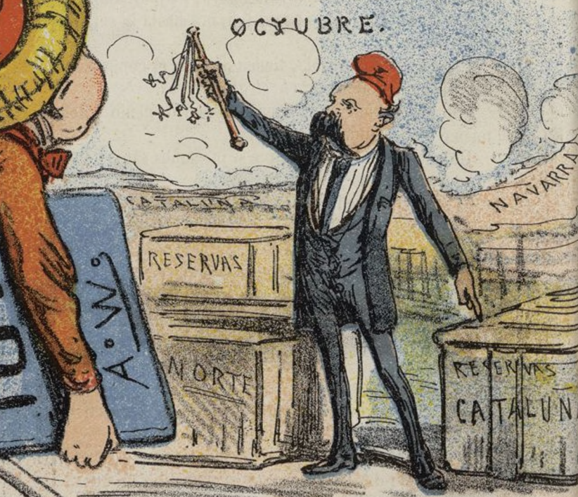
RESERVA DE LA DISCIPLINA.