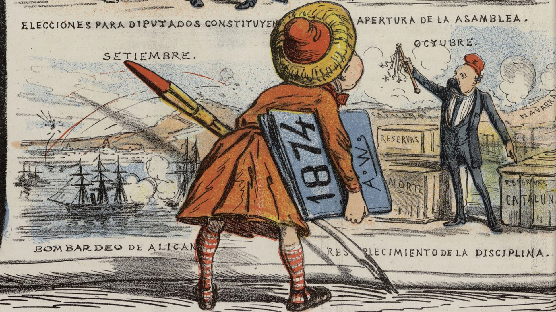
BOMBARDEO DE ALICANTE