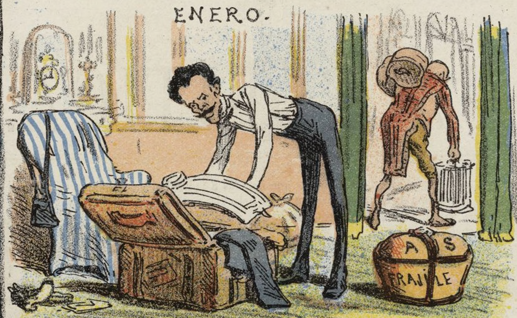
EL SEÑORIYO DISPONE LA MALETA.