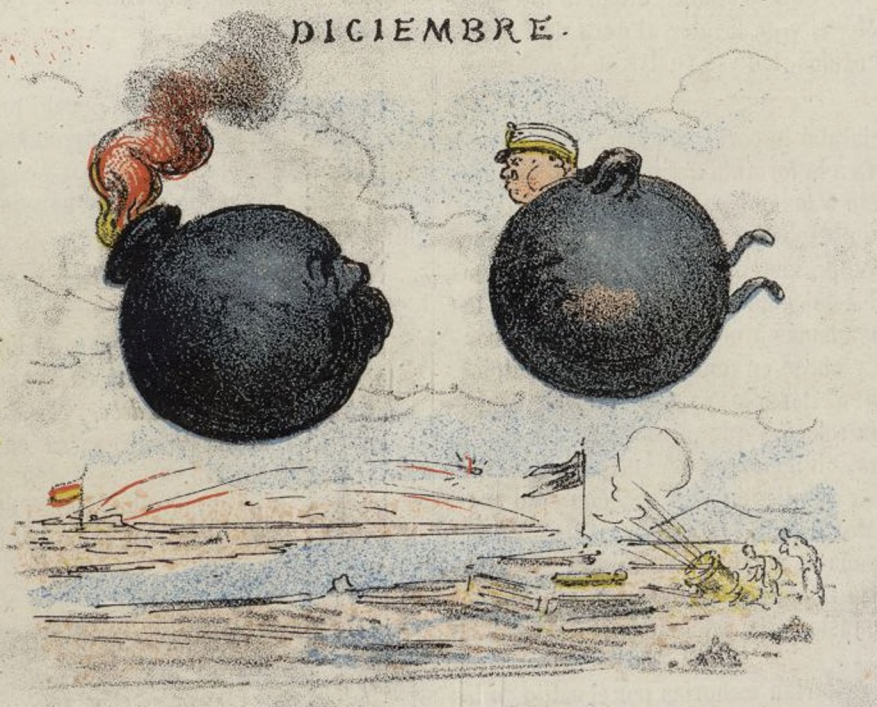
LO DE CARTAGENA.