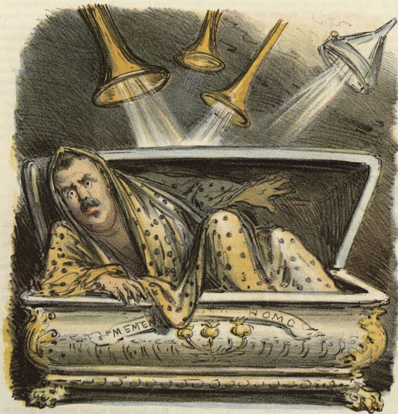
La resurreccion de la carne