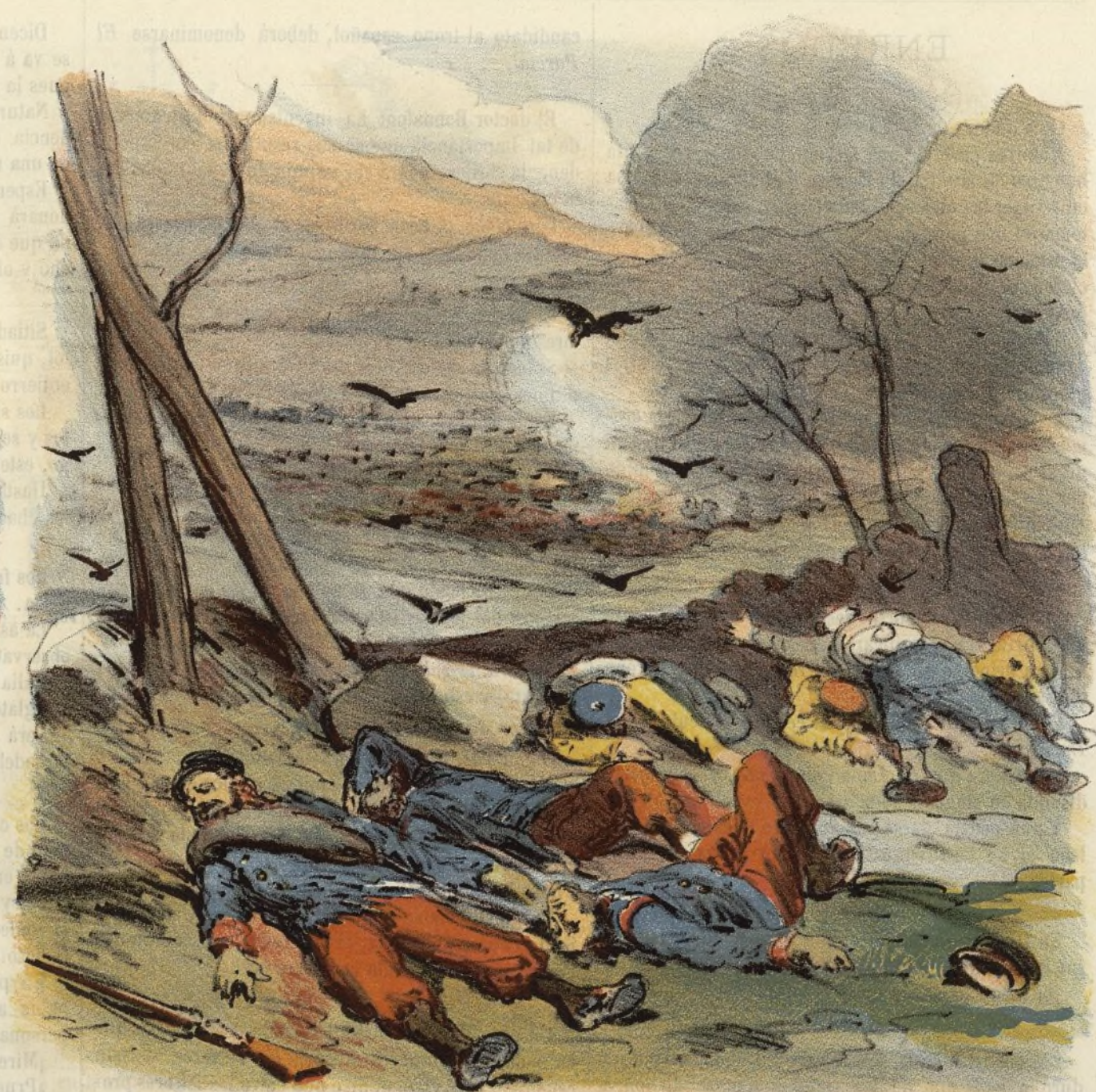
en este valle de lágrimas