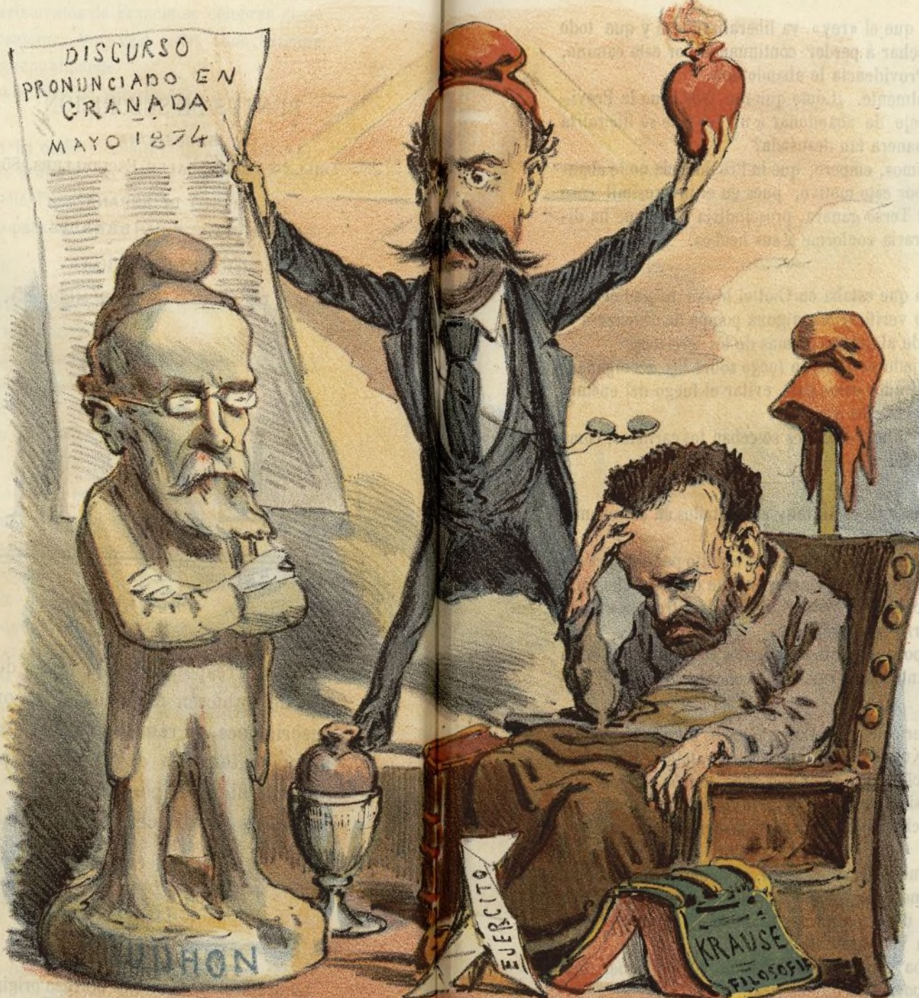
tres personas distintas