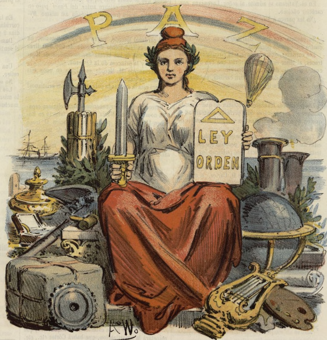
vida, dulzura y esperanza nuestra.