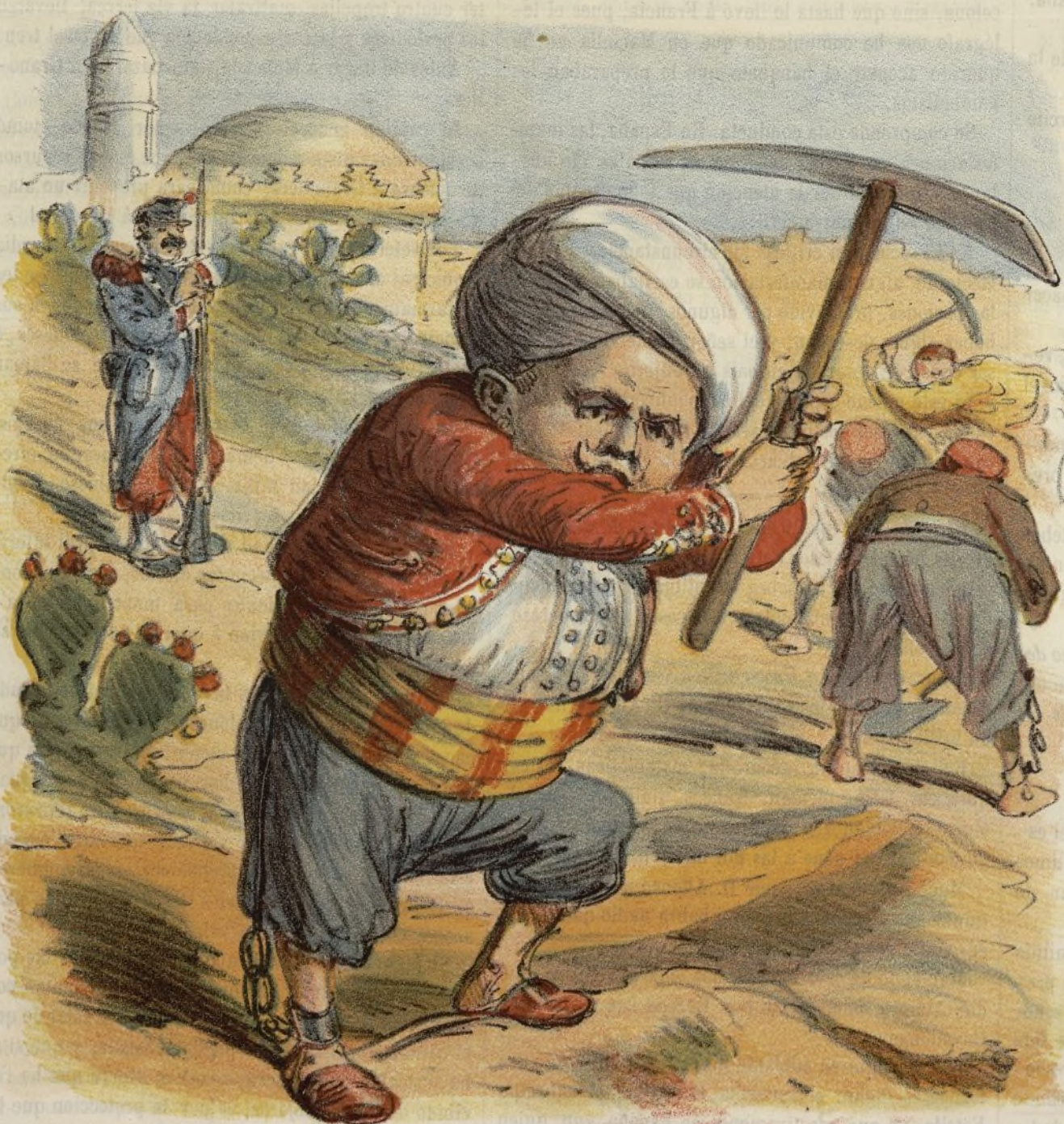
los desterrados hijos de Eva