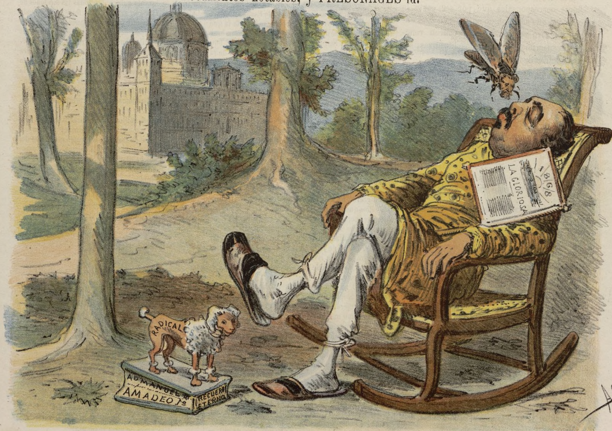
La novena maravilla.