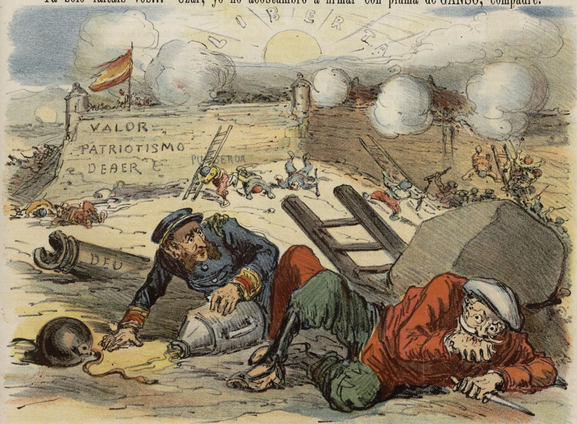
Cuanto más alta es la ascension más terrible es la caída.