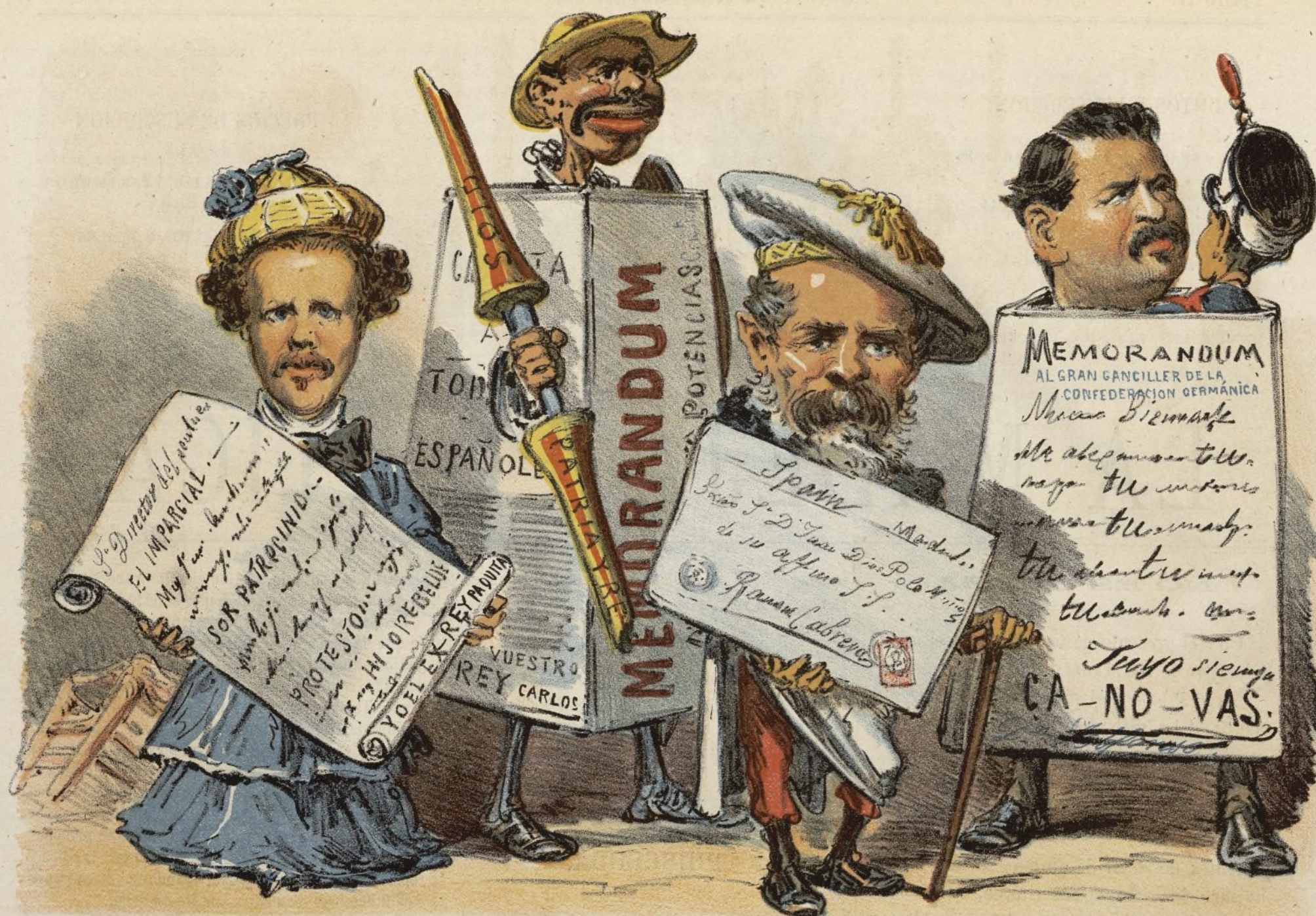
Documentos notables, y PERSONAGES id.