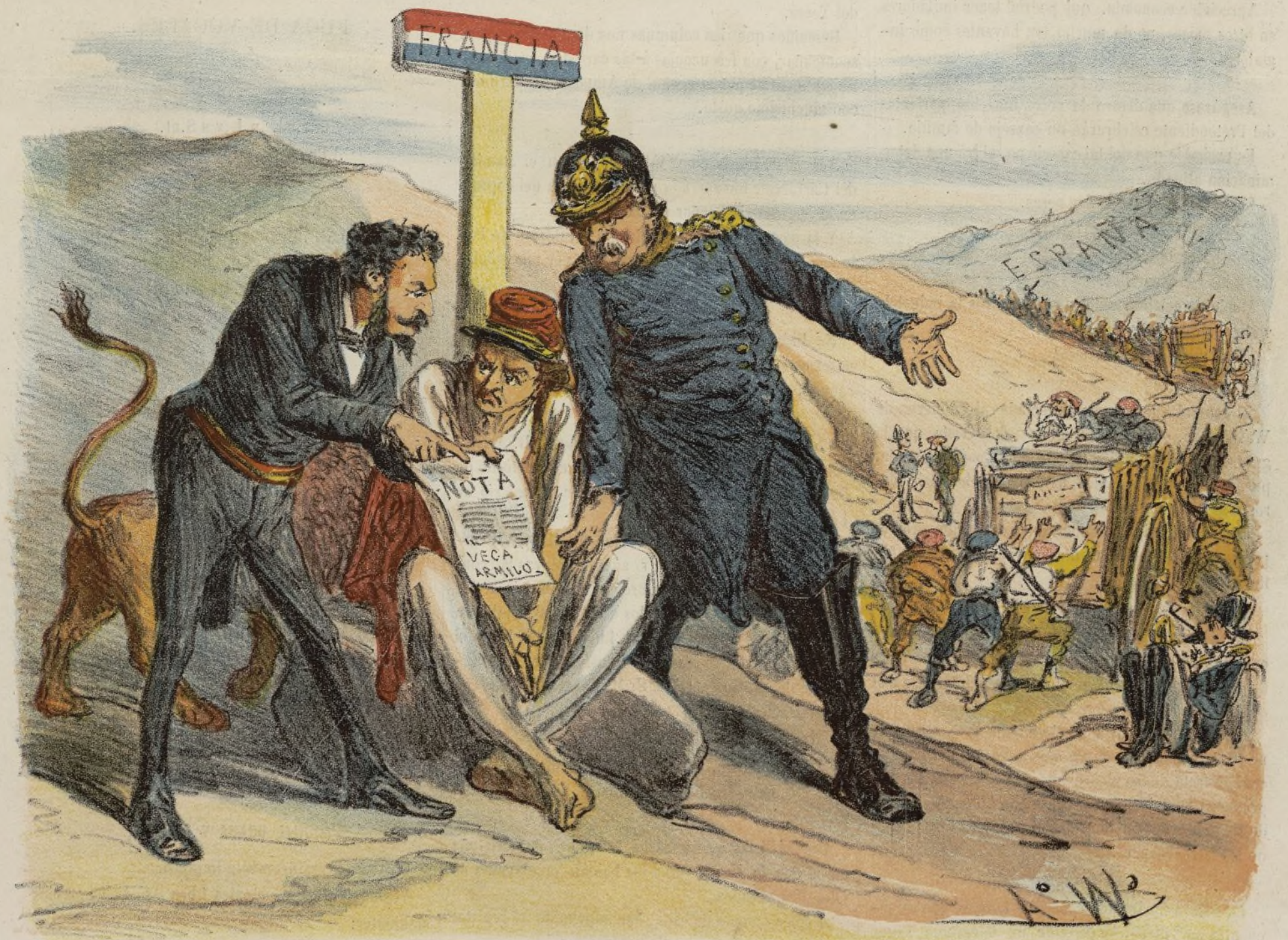
Aun es tiempo cumplid con vuestro deber... de otra suerte no respondo de lo que puede sucederos.