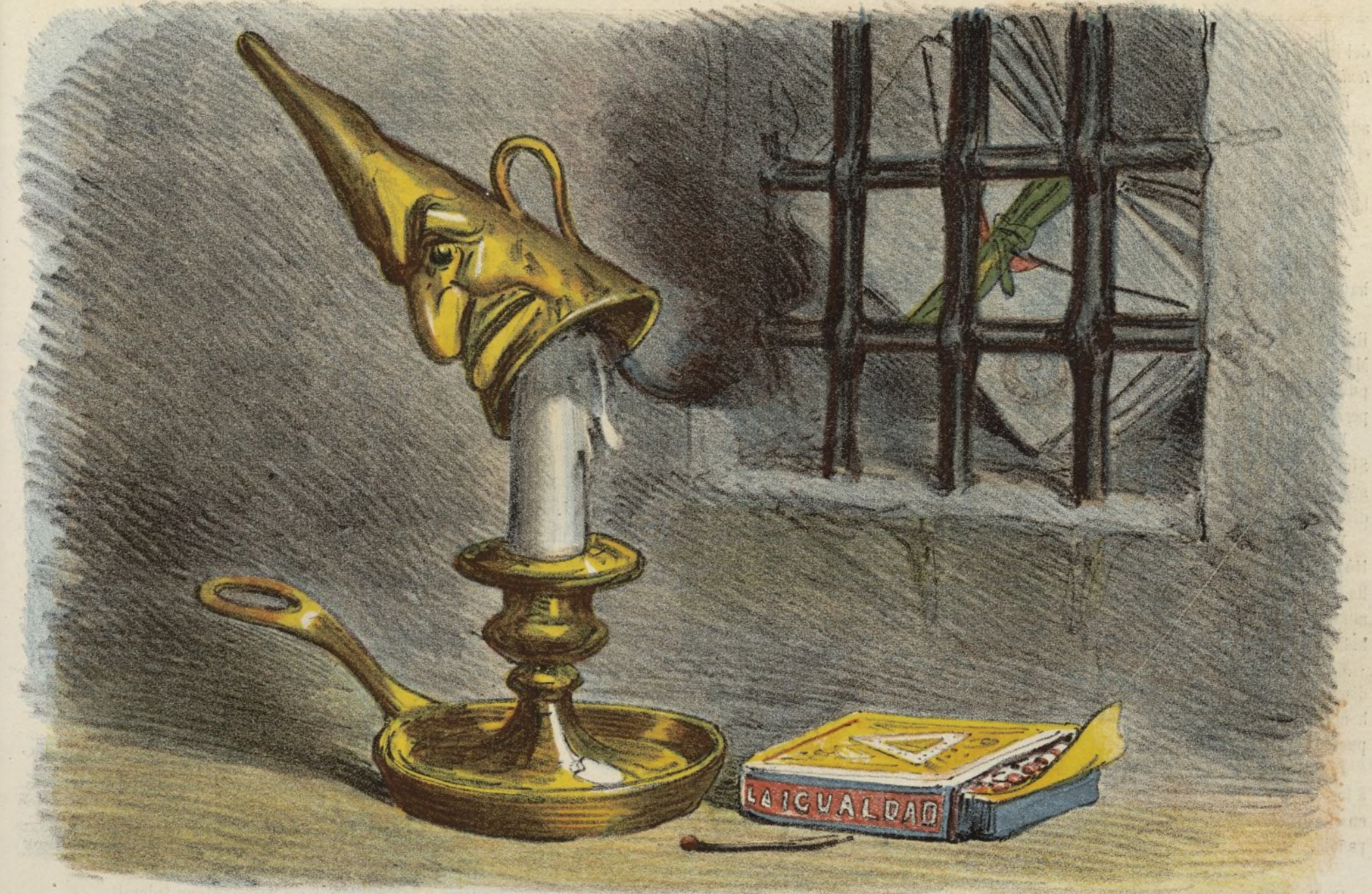
¡¡Luz... luz... luz!!!