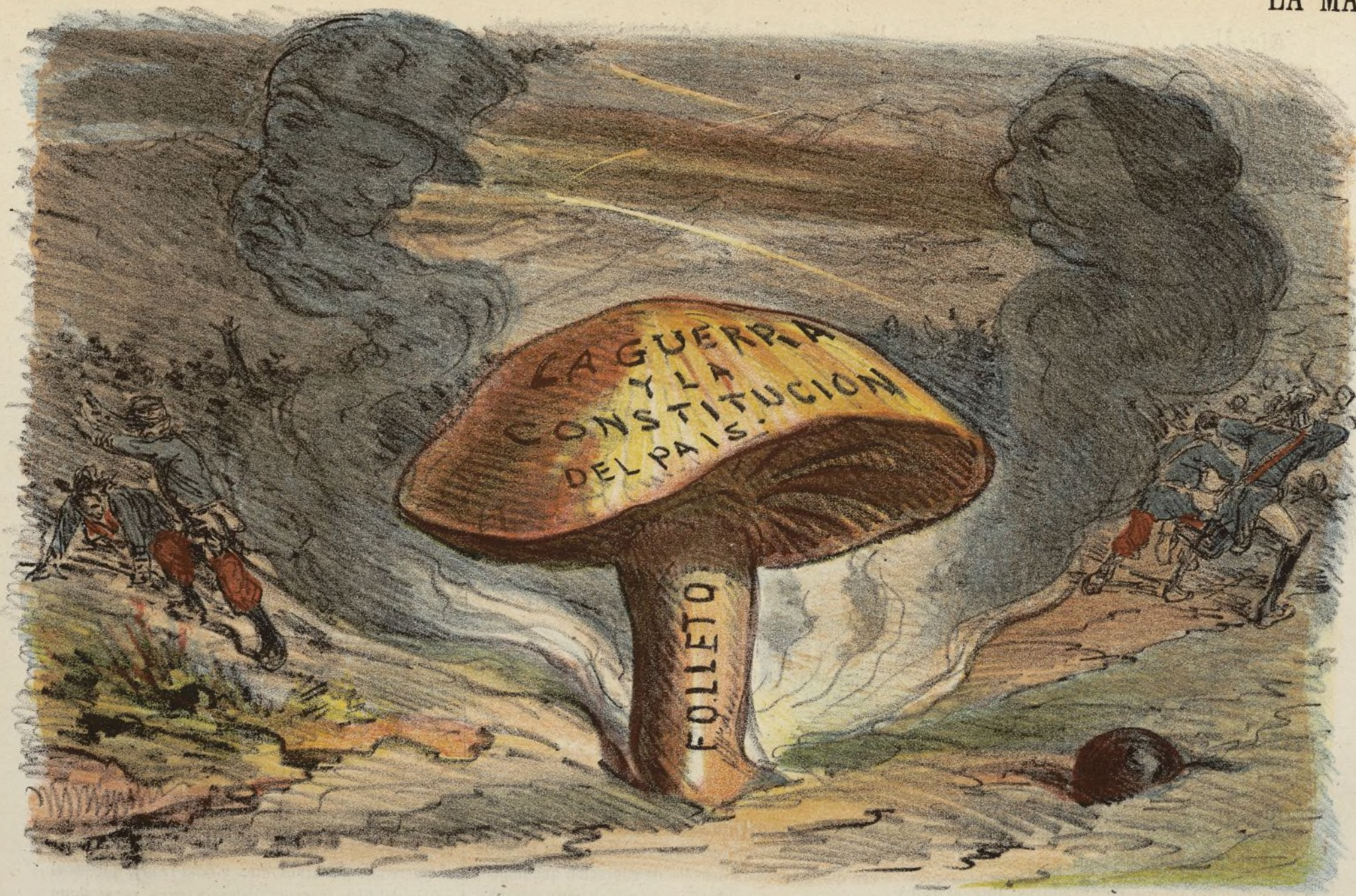
Folleto considerado hasta la fecha, de generacion espontanea.