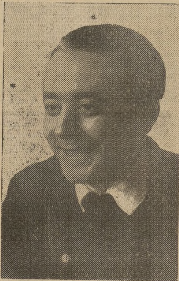
Castro, Comandante del 5.º Regimiento

drid, que a todas las fuerzas que combaten en su frente, se les impongan nuevos sacrificios, más esfuerzos aún, más héroes caídos para evitar que el ataque que prepa-