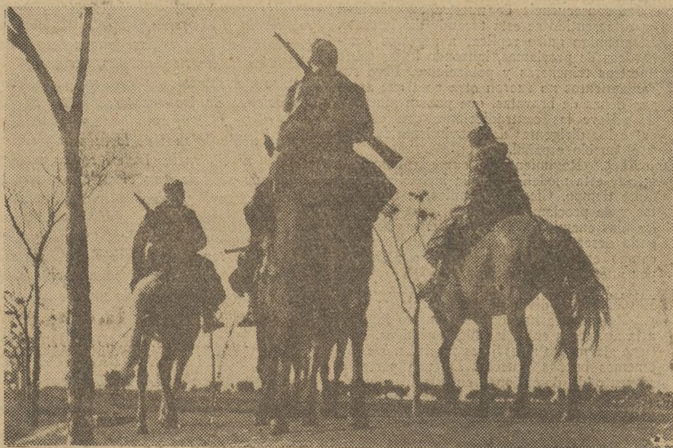
FRENTE DE TALAVERA.—Fuerzas de nuestra Caballería en un avance

♦♦♦♦♦ Toda la retaguardia se apresta a colaborar entusiásticamente para que nuestros milicianos y sus familias celebren las Navidades