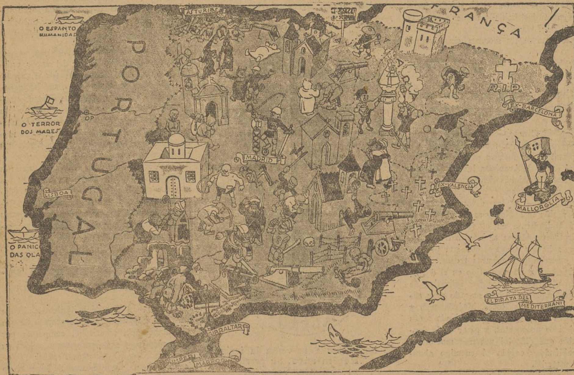
Mapa de España, si triunfasen los fascistas