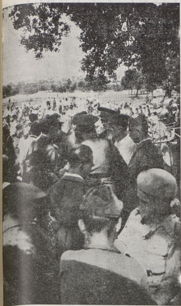
En el festival organizado por el Batallón núm. 6, nuestros soldados tuvieron ocasión de divertirse, siempre en el tono de moralidad que es norma de los antifascistas.