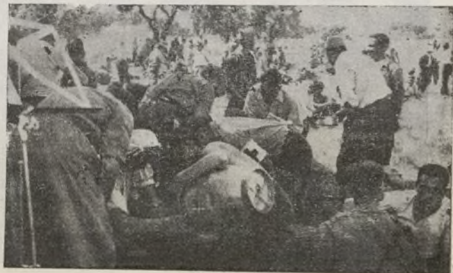
Un momento de alegría para nuestros soldados.

Todo lo hecho es un gran paso hacia la victoria. Ciertó. Pero no me-