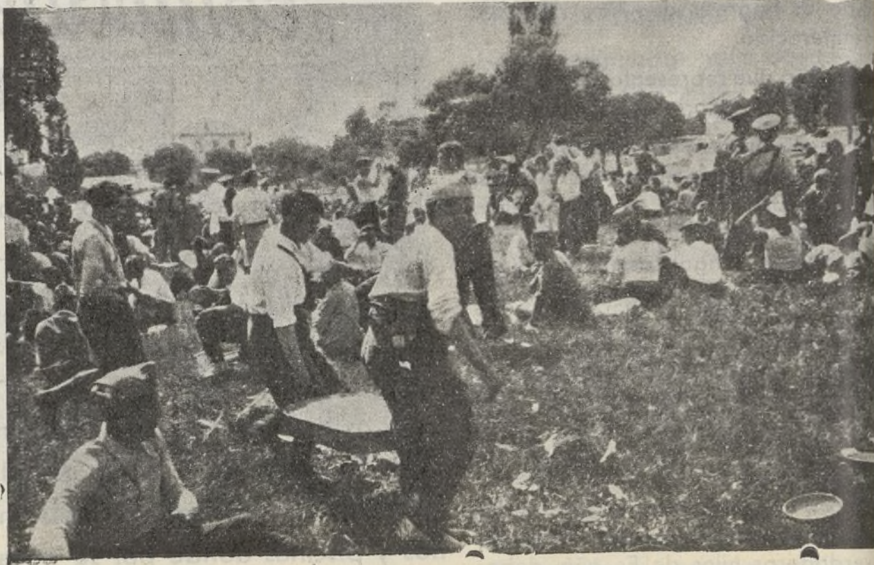
Un momento en el que nuestros combatientes llenos de alegría disfrutaban el descanso merecido

No desaprovechéis inútilmente las municiones. Si alguno lo hace, deberá conocimiento de él a vuestros superiores. E derrochar municiones es un acto faccioso.