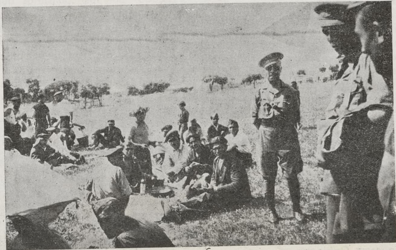
Un animado aspecto del festival del domingo