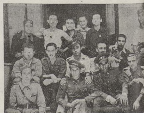
Grupo de camaradas de la Imprenta, acompañados de varios oficiales de la Brigada