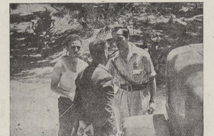
Camarada, yo quiero saber... y el representante en Madrid de la Brigada hace salir de la duda al camarada que pregunta.

(1) La composición literaria del tren que encabeza este escrito, no me pertenece, la copié de un libro siendo chico.