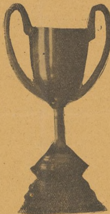
Copa del S. R. I., ofrecida al equipo vencedor, que ganó brillantemente la 2.ª Brigada.

avanza solo; centra y la recoge Covisa batiendo, por primera vez.