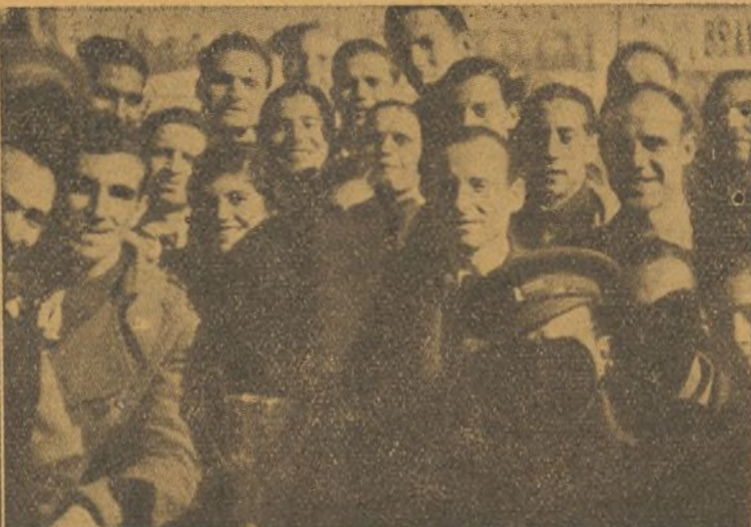
El premio ganado, en manos de nuestros jugadores.