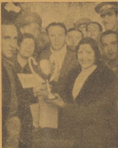
La Secretaria de Ayuda del S. R. I., haciendo entrega de la copa al capitán del equipo de nuestra Brigada.