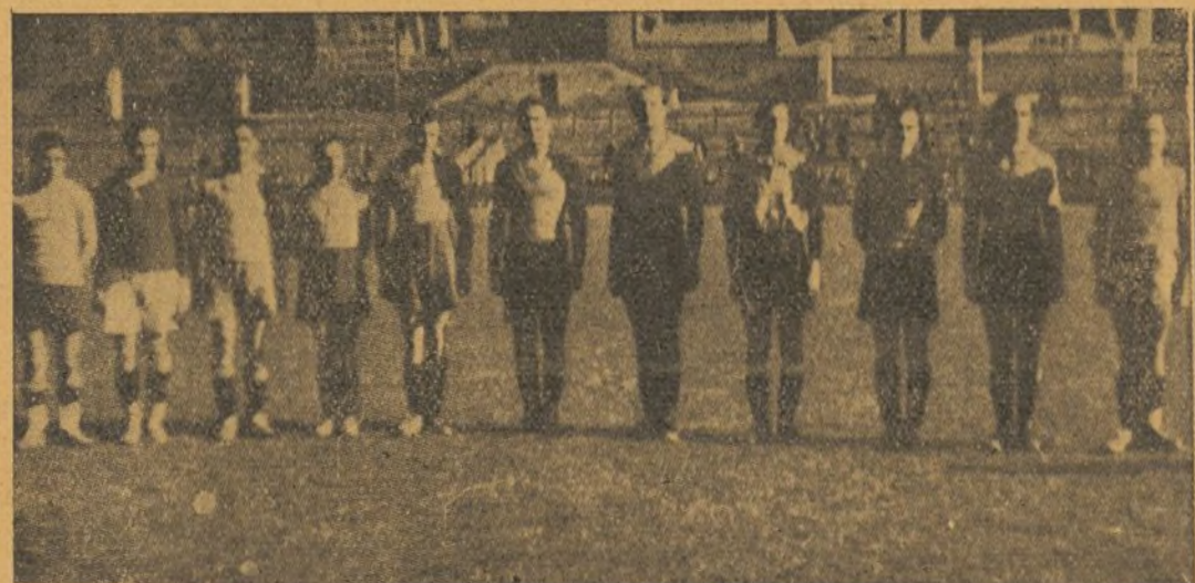
Los jugadores de Artillería formados ante la tribuna presidencial.

La aspiración de todos, momento, es ganar la guerra (Palabras del Presidente Cortes españolas, Martínez rrio, en el mitin por la Ay España, celebrado en París.