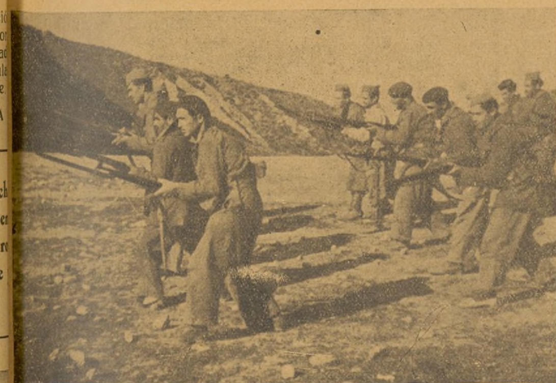
Nuestros hombres aprenden, sin cesar, el mejor manejo de las armas, adquiriendo los conocimientos precisos para vencer en la lucha.