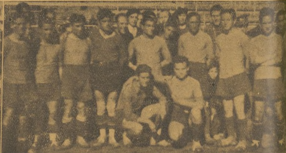
El formidable equipo de la 2.ª Brigada, vencedor del de Artillería