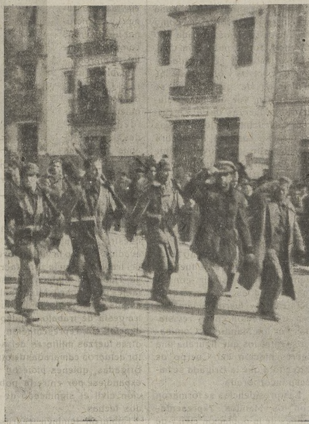
Fuerzas del 7. o Batallón saludan al pasar ante la Presidencia del desfile de nuestra Brigada.