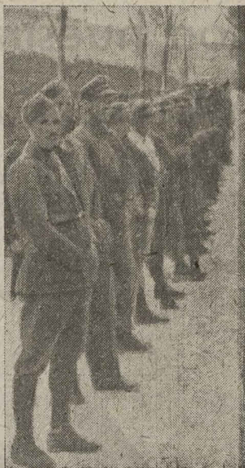
¡Tan firmes en la formación como en la trinchera, nuestros soldados vencerán!

Pertenece, pues, a la esencia del hombre, el dar sentido a su vida y a su paso por el mundo, el realizar cosas y actos valiosos de cuya existencia tiene clara e intuitiva comprensión. «La esencia de la vida humana es tener finalidad.»