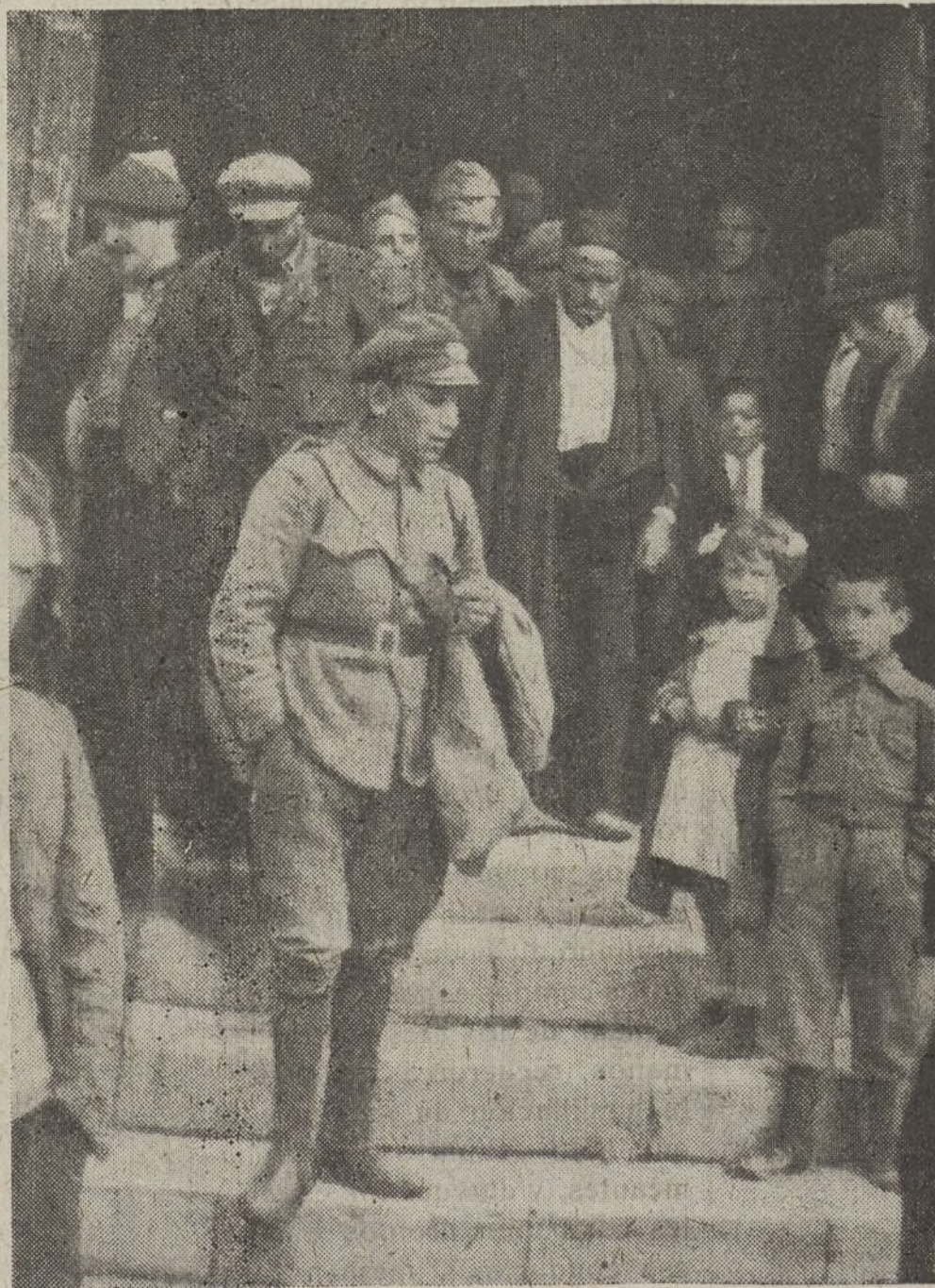
La población civil, fraternalmente unida a los combatientes, sale de escuchar el patriótico acto que para ella organizaron los Mandos de la 2. a Brigada.

Inauguró un representante del Consejo Municipal, que manifestó su satis-