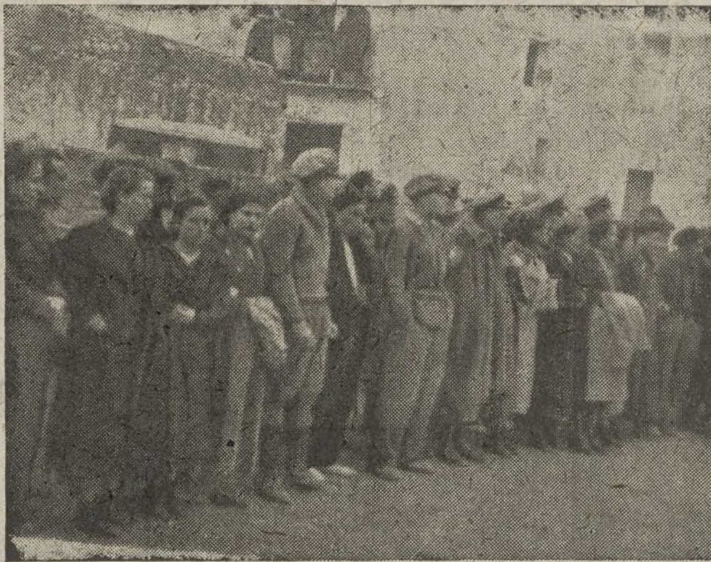
Los Mandos de la Brigada, población civil y camaradas de la retaguardia formando la Presidencia del desfile.

unidos a sus camaradas de los frentes. Tomó la palabra además un delegado de Compañía de la Brigada, quien recordó que hace ya dos años no podemos celebrar la fiesta de 1.º de mayo en la paz y afirma lo haremos con júbilo en la próxima.