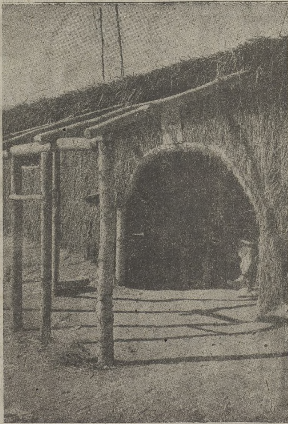
Cuando los locales no existen, los milicianos de la Cultura saben construirlos con los materiales más a su alcance y la ayuda de los propios alumnos.