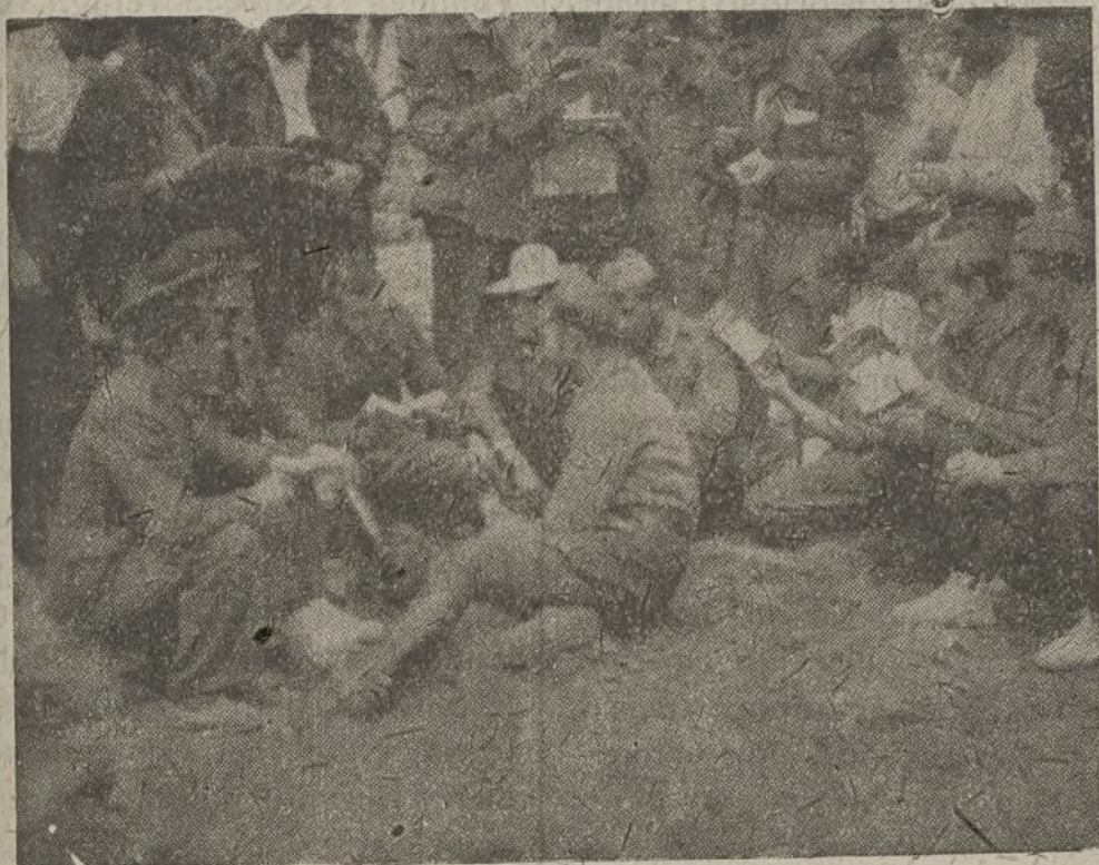
Donde no hay escuelas ni pueden construirse, Milicias de la Cultura trabaja al aire libre.

primer término, una labor de captación de la confianza de los combatientes analfabetos. El hombre ignorante es algo receloso, presenta cierta superficie de resistencia y la primera tarea que nos señalamos fué vencer esa resistencia.