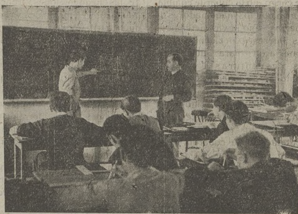
Cuando Milicias de la Cultura encuentra locales apropiados, monta en los frentes de combate escuelas modelo para capacitar a los combatientes.

números que conocen los alumnos y con ellos se opera.