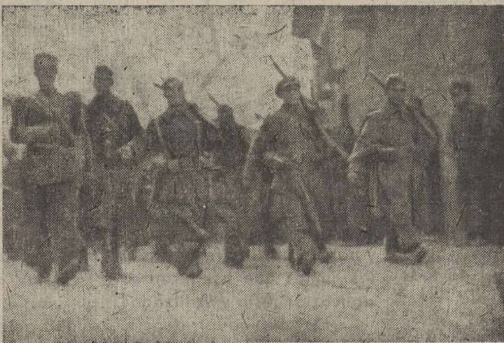
Los combatientes, marciales y animosos, marchan con la soltura de soldados en la paz, que llevan enganchada en la punta de sus bayonetas.