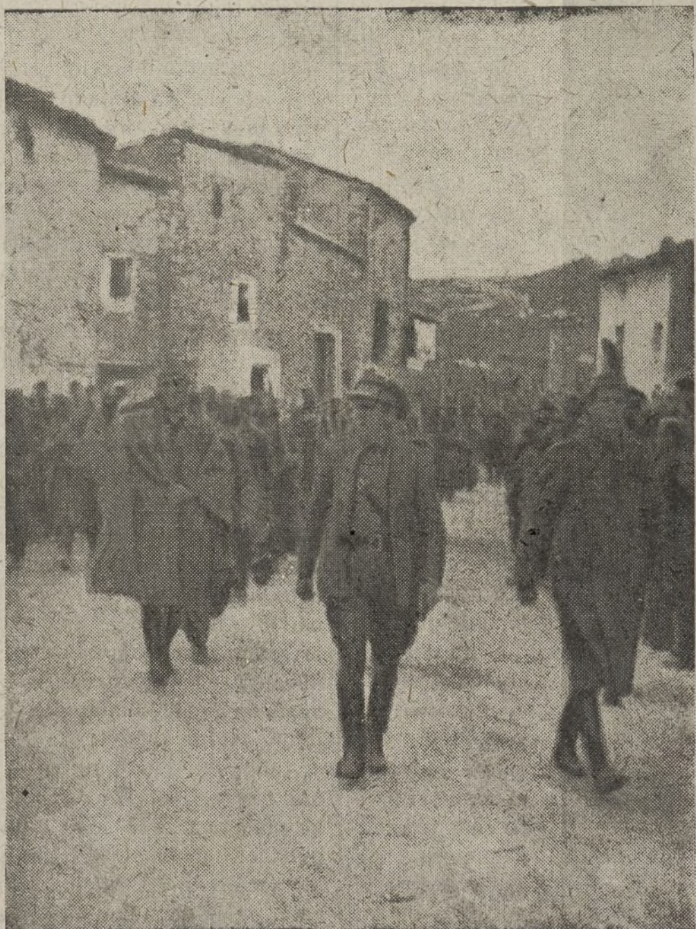
El 6.º Batallón de la Brigada desfilando marcialmente el día de la Fiesta del Trabajo.

Recordó a nuestros héroes, caídos en la lucha, y finalizó diciendo que ellos no pedían más