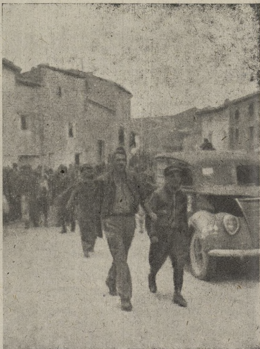
El 8.º Batallón de nuestra Brigada al iniciar el magnífico desfile de 1.º de mayo.