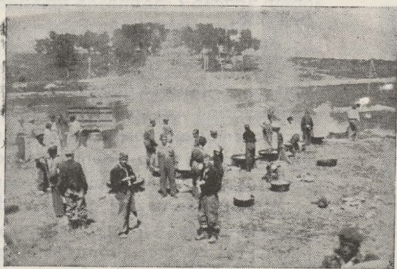
Los días de lucha en los frentes han hecho de nuestros luchadores verdaderos especialistas, he aquí la cocina del Primer Batallón modelo de organización.

5.º Si hubiera inflamaciones se recomienda la aplicación del calor seco. Lo más sencillo es preparar sacos del tamaño de la palma de la mano que se llenan de arena o harina no muy apretada. Estos sacos se calientan sobre la tapa de un puchero lleno de agua hirviendo y se aplican sobre la parte inflamada, tan caliente como se pueda resistir; en cuanto comienza a enfriarse el saco, se renueva con otro caliente. El calor se aplicará en esta forma dos o tres veces al día en sesiones de una hora. En estos casos se acudir también a consultar al odontólogo.