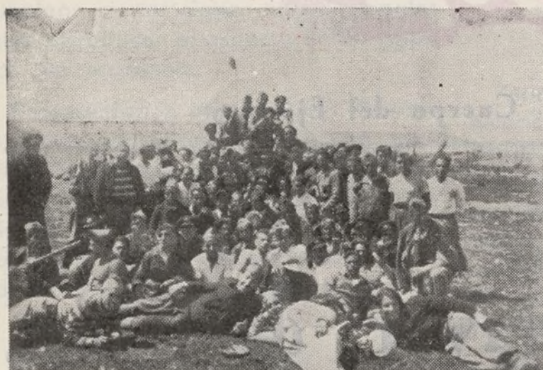
El mayor jefe de la Brigada y el comisario general, rodeados de un grupo de alegres camaradas del Primer Batallón.