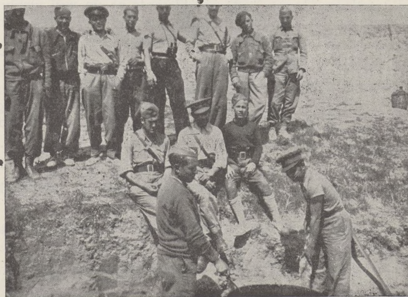
Una cocina en las trincheras de una compañía del tercer Batallón. Jefes y oficiales contemplan el arte de nuestros cocineros. Salud camaradas.

Camaradas, vosotros que tenéis y habéis tenido tan cerca al enemigo, a vosotros os corresponde el demostrarle nuestra superioridad, el enemigo tiene su material de gran potencia optica, tiene telémetros, etc. por lo que es preciso que vea que nosotros, Ejército popular, somos ejemplo de heroísmo y disciplina, con lo cual verá el mismo cada día más próxima su derrota.