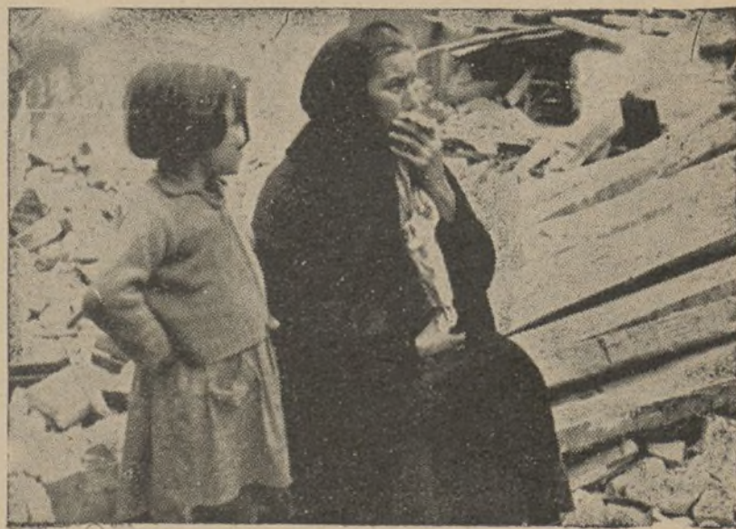
Las mujeres y los niños españoles, miran con horror los aviones alemanes

TU OPINION SOBRE TU PERIODICO "NUESTRA BRIGADA"