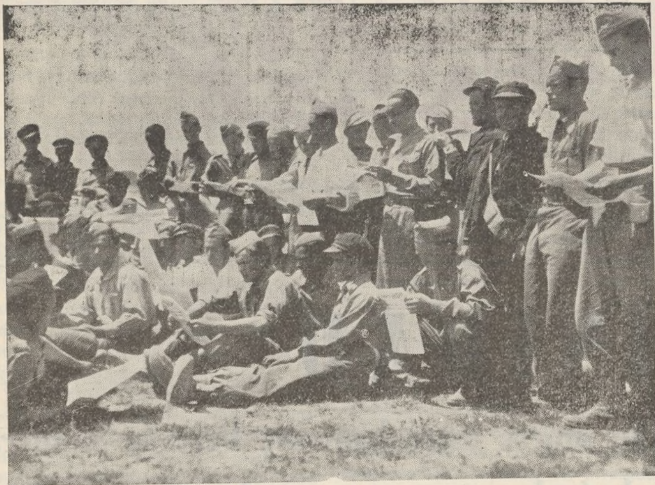
En nuestras líneas, la llegada de Nuestra Brigada, es recibida con la alegría y satisfacción de saberse fielmente interpretados por nuestro periódico, que vive en toda su intensidad las inquietudes de nuestros combatientes.