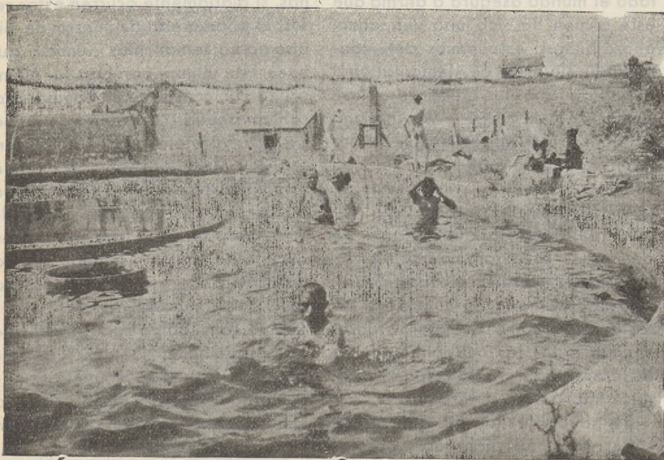
Cultura física en Nuestra Brigada