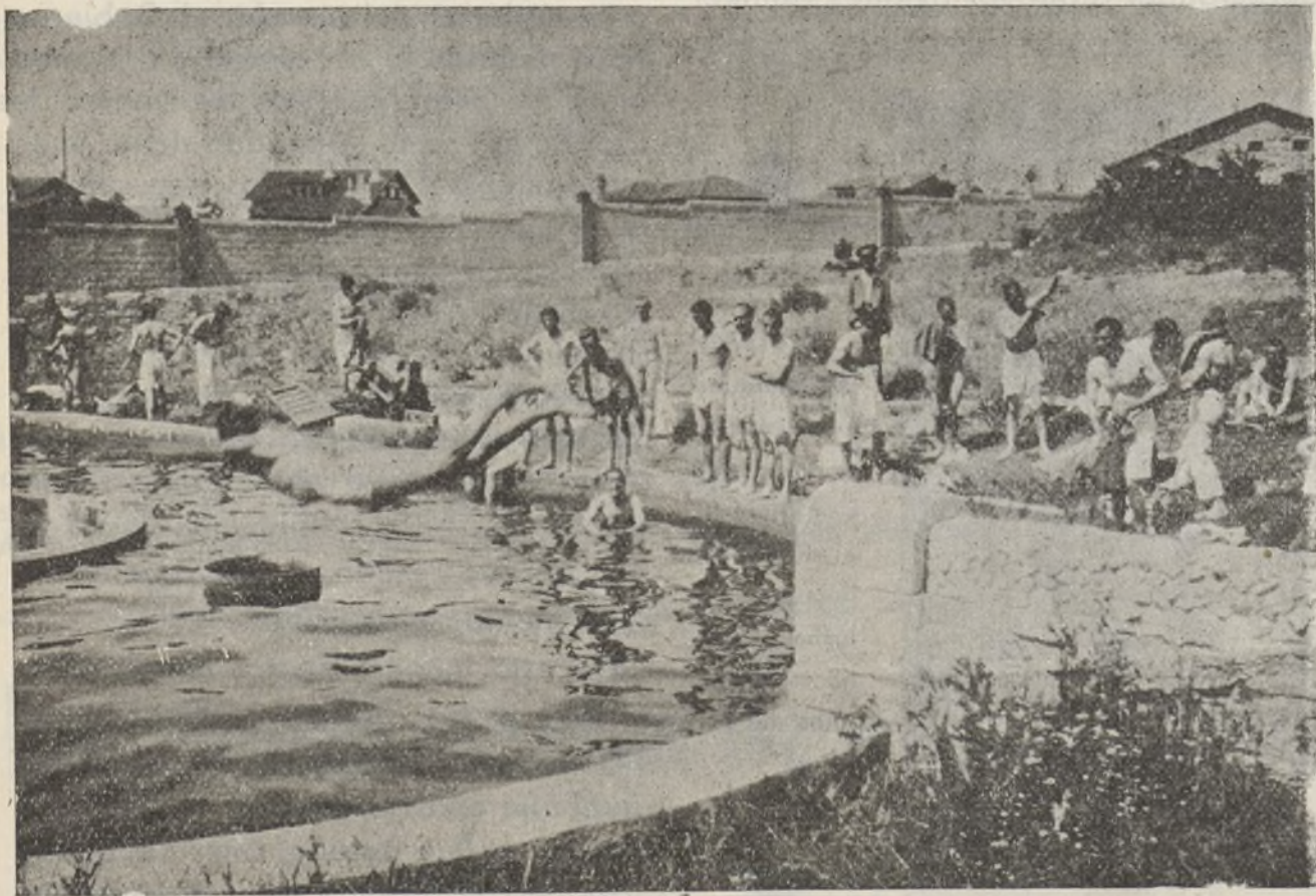
Fuertes, Sanos y disciplinados, estos son nuestros combatientes.

Las Agencias extranjeras, primero, y las Radios facciosas, después, han dado la noticia de que el «Generalísimo número dos» ha muerto víctima de un accidente de aviación; la noticia ha sido acogida con la natural alegría en el territorio leal, pues el extratega de la toma de San Carlos era odiado y aborrecido unánimemente por todos los antifascistas.