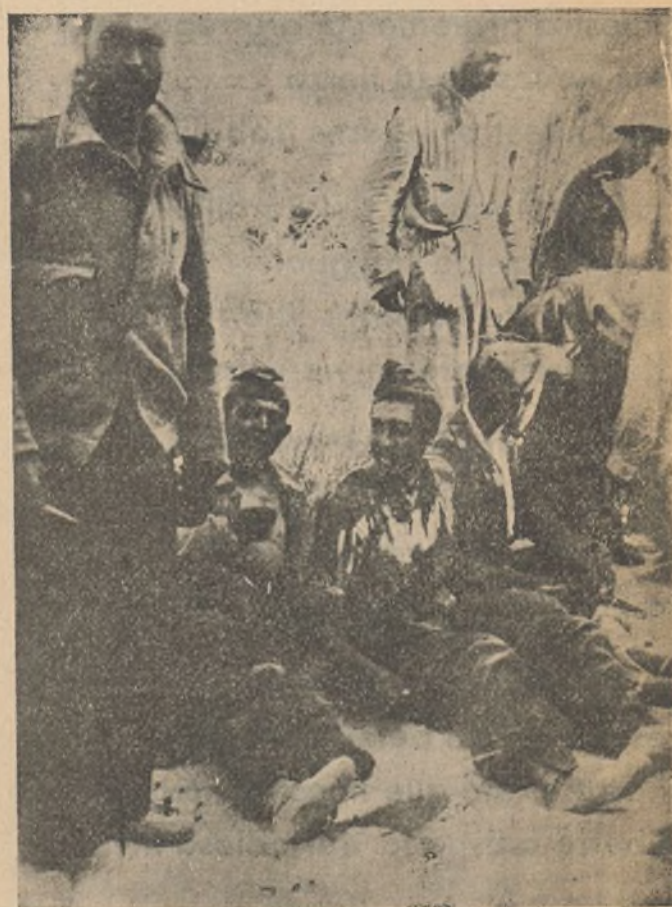
Soldados de nuestra Brigada, ríen satisfechos de haber sabido cumplir con su deber.