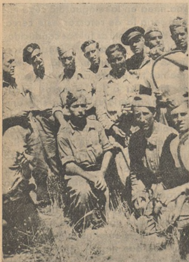
Un grupo de Oficiales y soldados pertenecientes al Quinto Batallón.

Camarada, ahora que sabes y conoces nuestra odisea sólo nos queda que decirte que en la gloriosa Brigada Mixta número 2, a la que voluntarios pertenecemos, honraremos a los que han sabido caer por la noble causa de la independencia y que en el puesto que se nos destine sabremos vengar a todos los camaradas muertos por la libertad de España.