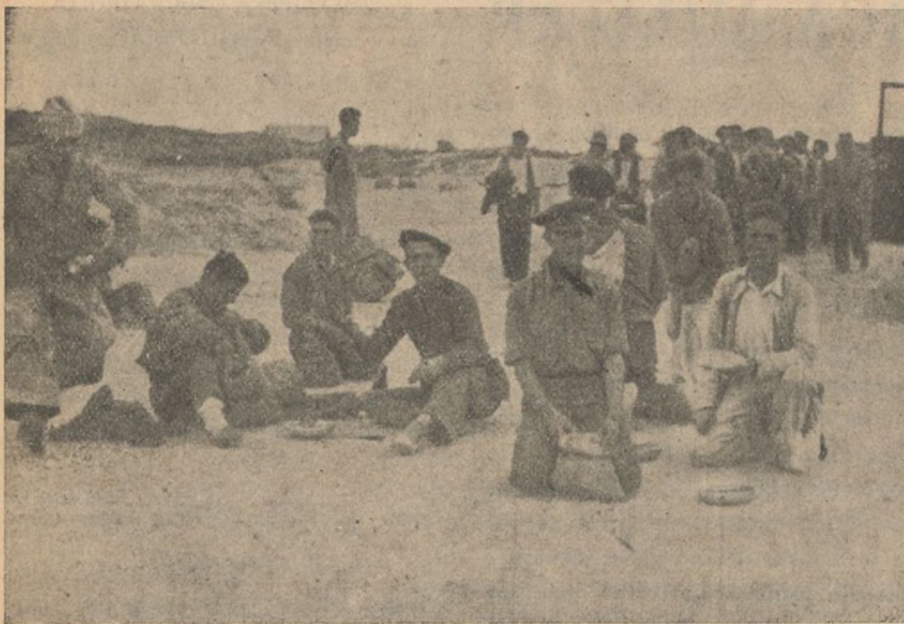
Los nuevos reclutas, en la hora de la comida, comen con apetito y se muestran orgullosos de adquirir cada día más una mayor capacidad de instrucción.