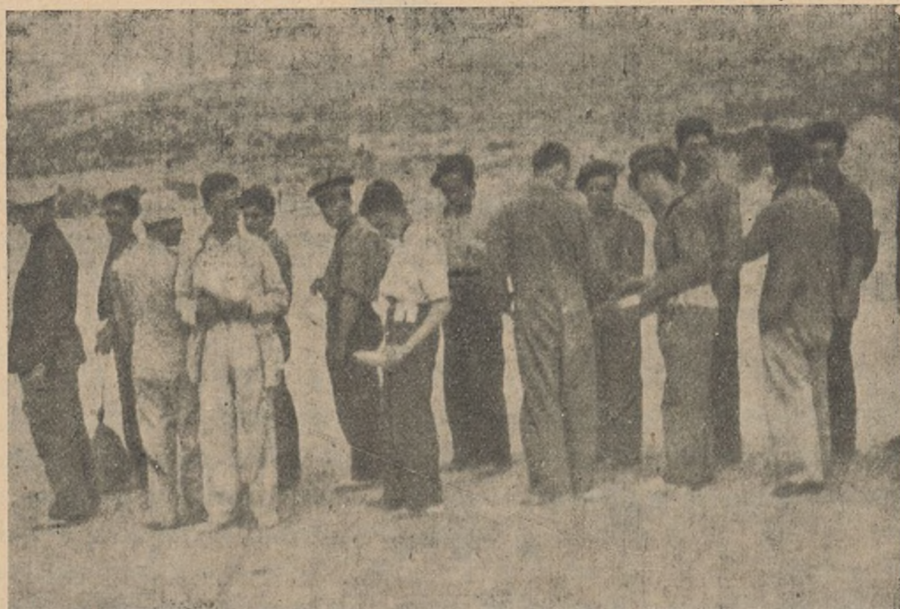
Los nuevos reclutas esperan disciplinadamente el momento de la comida.

Rechazar a los exploradores enemigos y guardar el contacto, si el enemigo se retira.