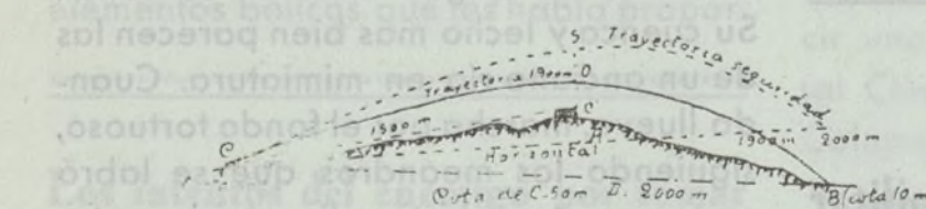
Tabla 1 ordenada de 1900 a 1500 (tropas propias)=59'40 m. luego C' O = -20 + 59'40 = 39'40 m.

En la tabla 4 vemos que a 105 milésimas de Ap más próximo es el de 1900 metros.