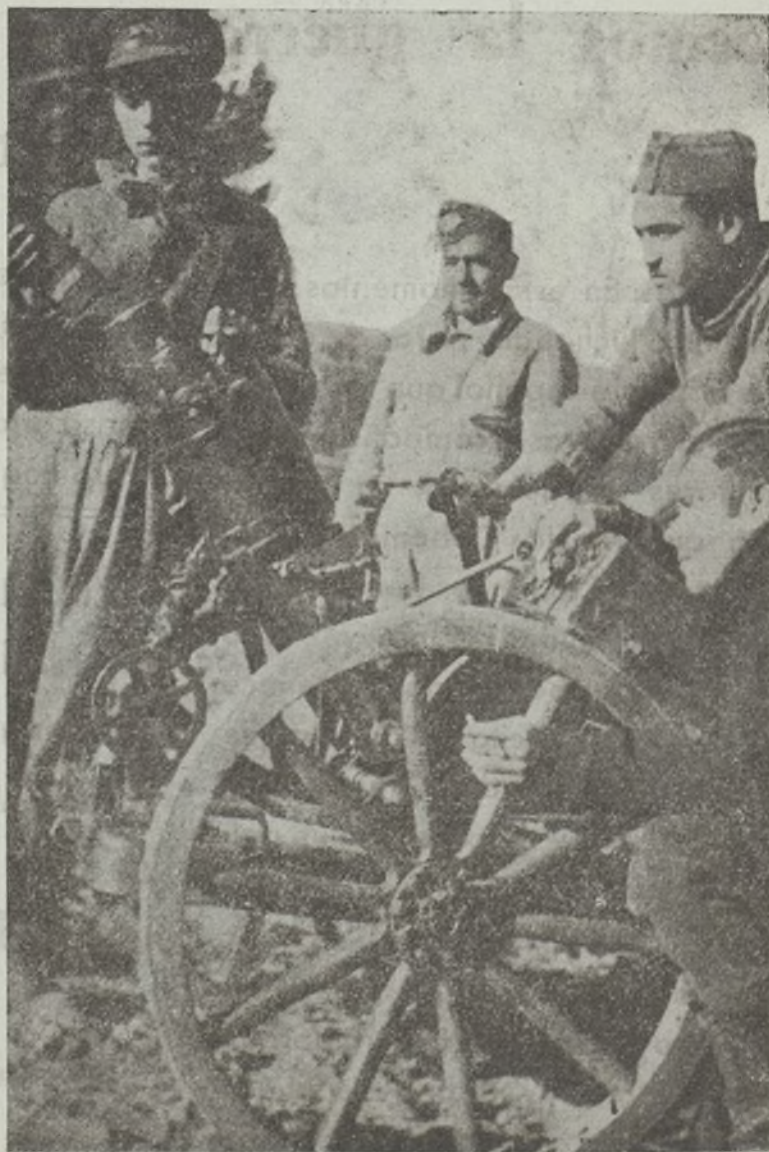
Los soldados de nuestra Brigada deben conocer a la perfección el manejo de todas las armas.

Por eso, al contrario que los del antiguo Ejército que se sublevaron contra el pueblo, debe sentir la necesidad de superarse diariamente en los conocimientos tácticos para ser más útil al pueblo que le designó para defenderle.