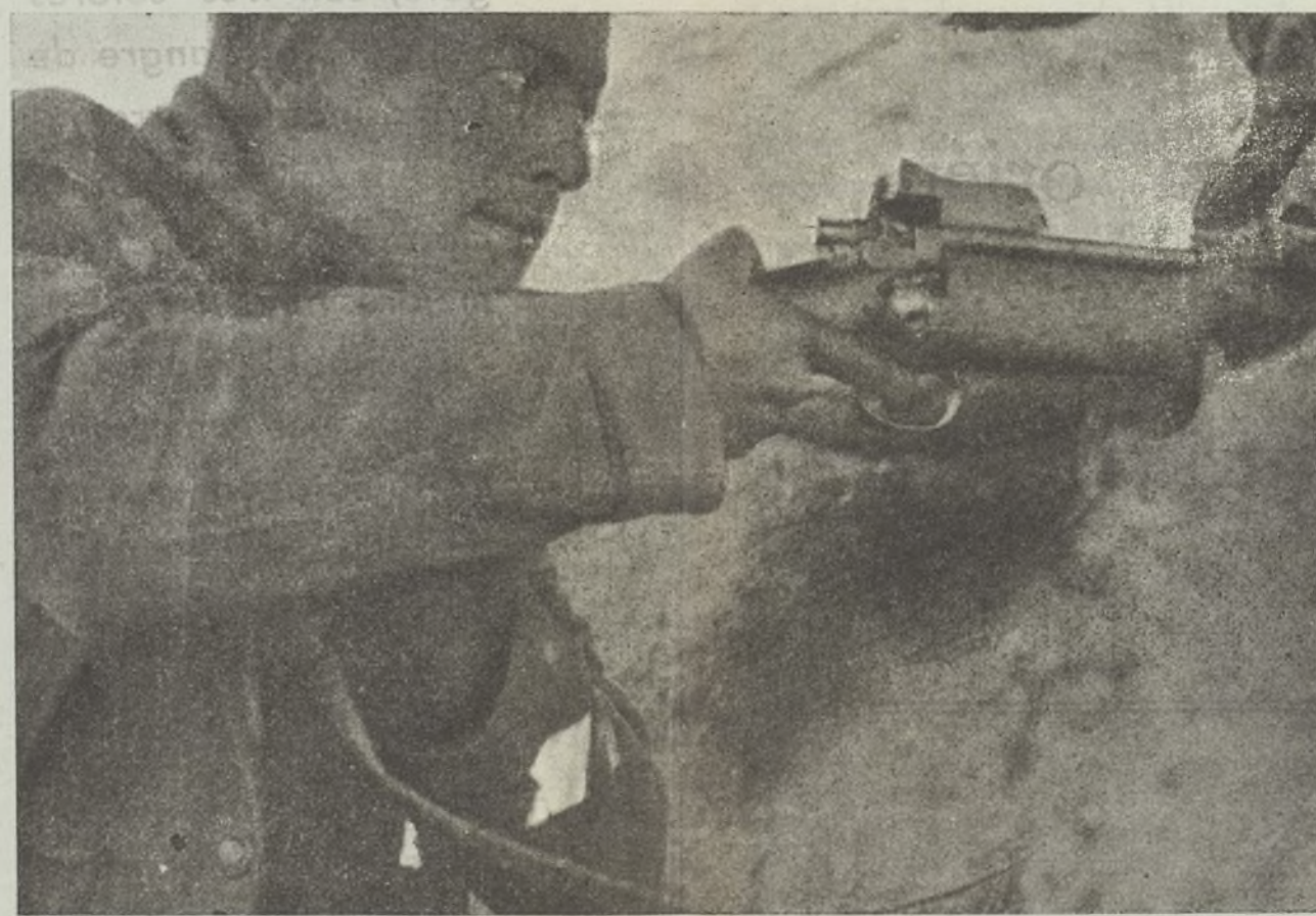
Heroicos defensores de Madrid, siempre atentos y vigilantes a los movimientos del enemigo, esperan el momento propicio para jugárselo por la independencia de España.

de fuego y sangre; por Avila que, tras las murallas, sueña sueños de monja enclaustrada; por Huesca, la de las tumbas de los dos héroes de Jaca; por la inmortal Zaragoza — negro recuerdo de Francia — la de los pechos bizarros, la de la jota bizarra; por Teruel, la de las momias; que amor inmortalizara; por Toledo, joya antigua, en duro acero incrustada; por Huelva, la marinera;