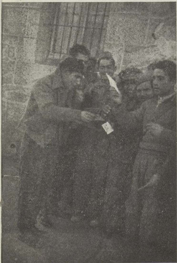
El correo llega normalmente a nuestras líneas, llevando las noticias de nuestros familiares, de nuestros amigos, que son acogidas con la natural alegría en todos.

Porque habrán visto también, como el pueblo español no lucha sólo por una causa de orden español exclusivo, sino que lucha también por los trabajadores ingleses y franceses, por todos los trabajadores del mundo.