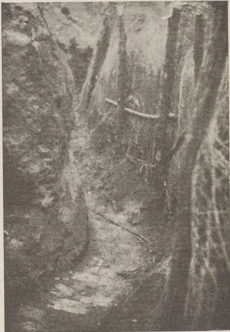
Vivir con dignidad en las trincheras es cuidarlas para que nos protejan la vida.

Lo mismo que cuidas el fusil debes cuidar de la trinchera, trabajando constantemente en la conservación de las mismas.