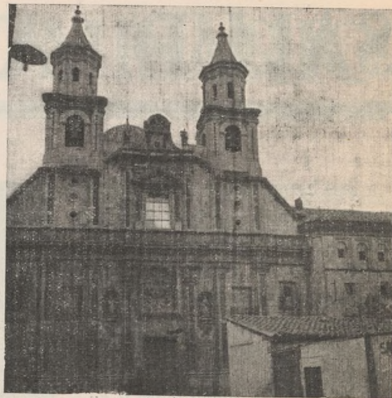
Seminario donde se hicieron fuertes y que nuestros soldados tomaron con bombas de mano.

Tiene, por lo tanto, como decíamos la reconquista de Teruel un valor más que el que en sí tiene el terreno liberado, es ante el mundo auténtica revelación de cerebros y de masas que, organiza-