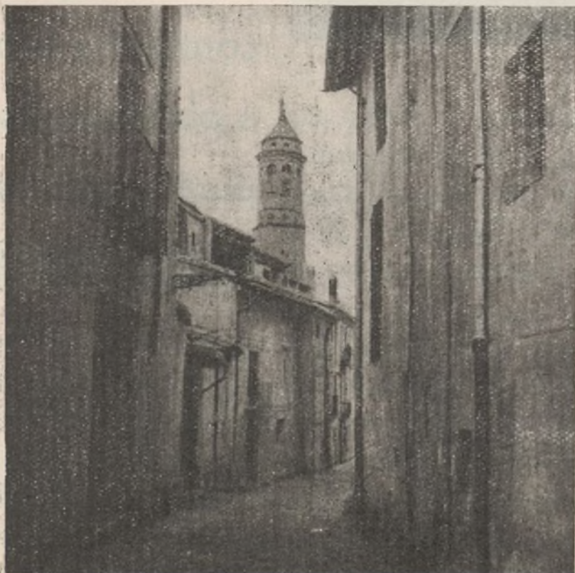
Una calle por donde nuestras tropas penetraron en Teruel.

Esta demostración de nuestra voluntad y firmeza podrá tener sucesos favorables para nosotros por parte de los sordos condicionales, pero no obstante, lo mismo que esta victoria no es motivo para nosotros de entregarnos a la confianza, sino que por el contrario redoblabamos nuestras energías, en el campo internacional tampoco expresaremos triunfos finales hasta no ver del todo derrotados a nuestros enemigos los fascistas nacionales e internacionales.