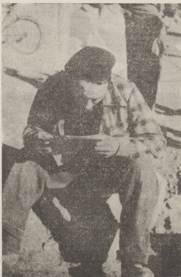
LEER PARA SER CULTO