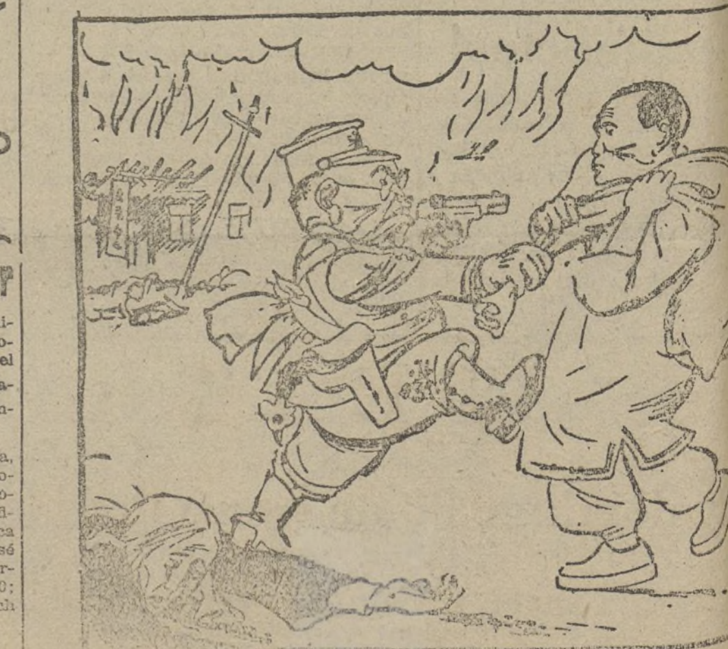
EL JAPON.—Dame voluntariamente el dinero que llevas en el saco para civilizarte.

Esta defensa de la paz preserva la salud del mundo, salvándolo del terrible tormento de la guerra.