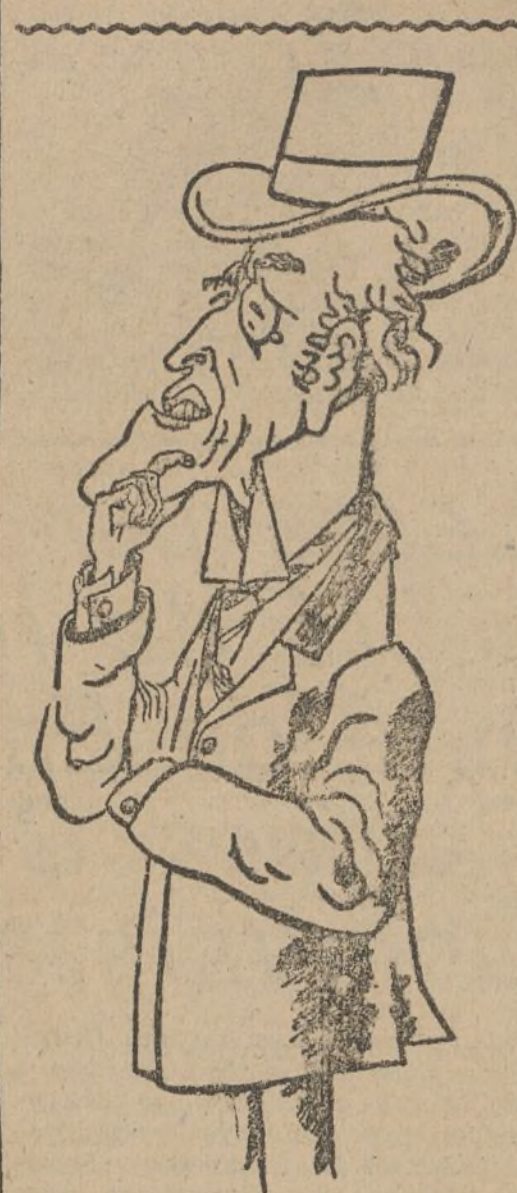
UN CONSERVADOR INGLES

Las tropas republicanas -- dice -- detienen la anunciada ofensiva de Franco