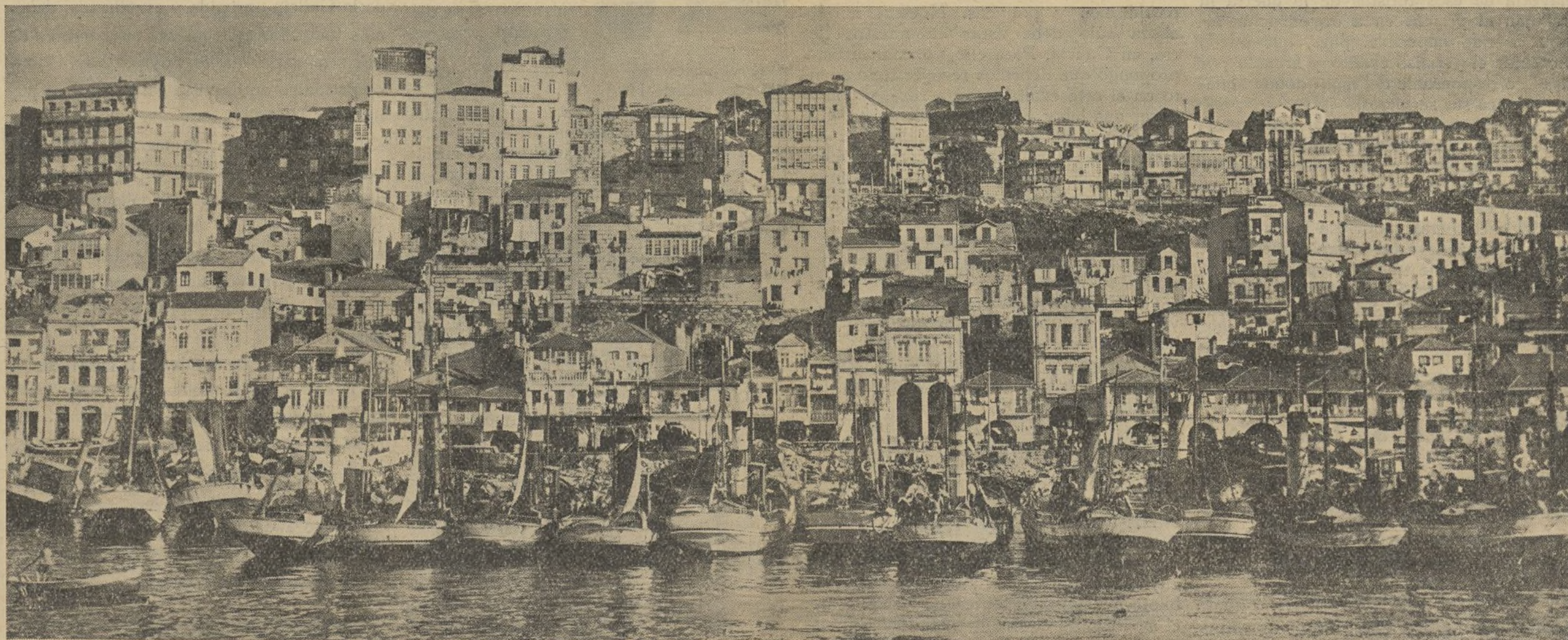
O Berbes xa non feu vida. As suas "parexas" tan amarradas. Todo e trisura e proveza n'este porto ante rico e bulidor.

surpresa foi terrible ó ver que os que chegaban eran todos os efectivos militares do reximento de Zamora, con ametralladoras e morteiros. Pro a reacción foi terrible. Todol-os homes e mulleses lanzaronse ós sistos de maior perigo, e a defensa perante forzas e material tan superior no numero e calidade foi encarnizada. Durou mais de seis horas. O fogo encontra os feixistas era arrepiante. Non podían chegar ós arrabaldes... Tiveron mais de setenta mortos... Cañearon o pobo. Entraron a sangue e fogo pol-as suas ruas, e dende ós balcóis, fiestras e eirados tirabanselles bombas, cartuchos de dinamita, pedras, mobeles e auga e aceite fervendo... Pro a forza impuxose e as oito da noite, despois d'haber sacrificado a mais de cen leales a Republica, os feixistas apoderaronse de Ribadeo... Entón lanzouse a Guardia civil, sumandose á rebelión, e comenza a practicar deténzas e a repartir cu-