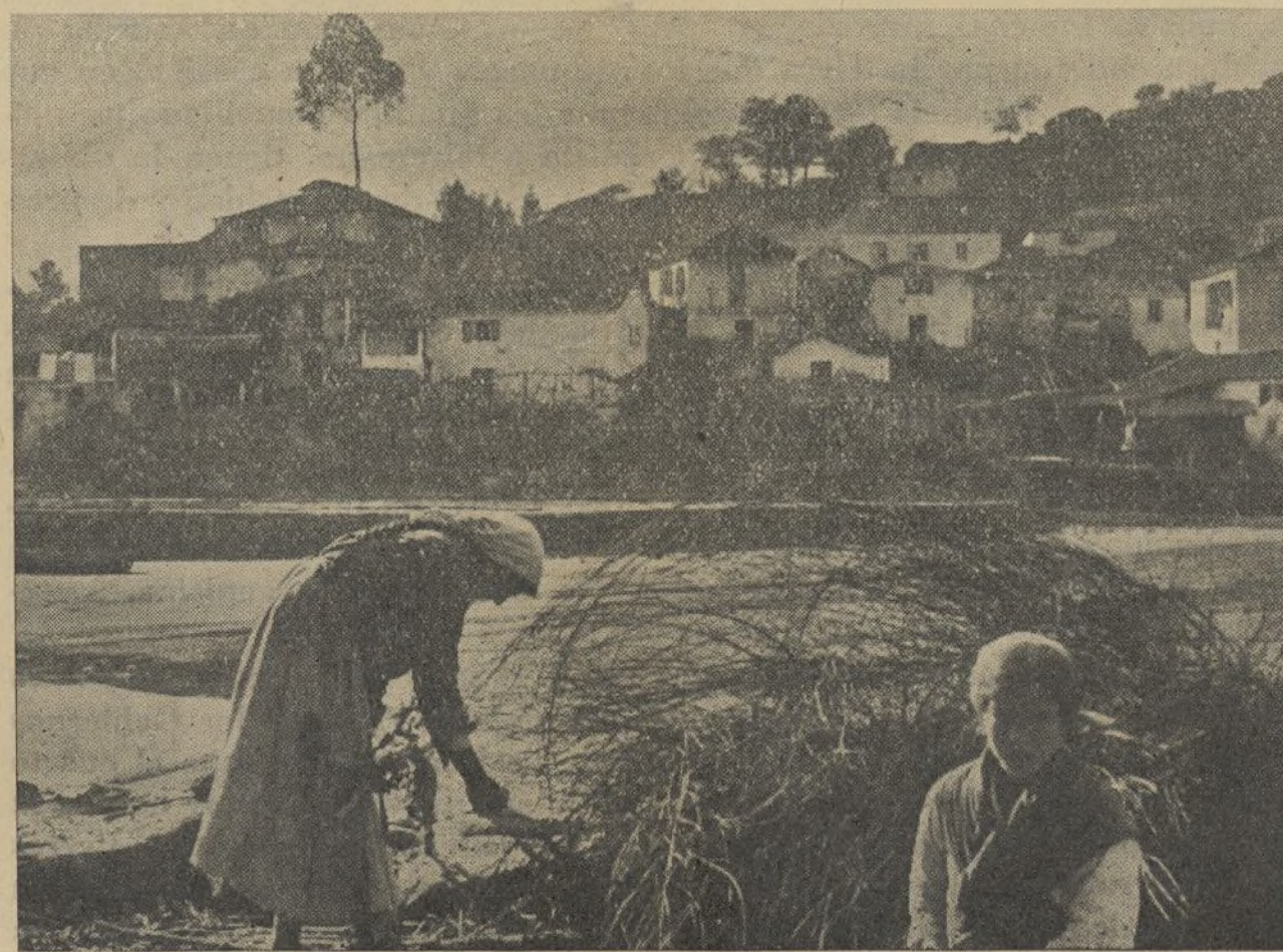
Velahí un lugar da nosa doce terriña, onde a muller ten que substituír a falta d'homos.

—He ingresado en el Cuerpo de Asalto, donde desde el primer momento luché con