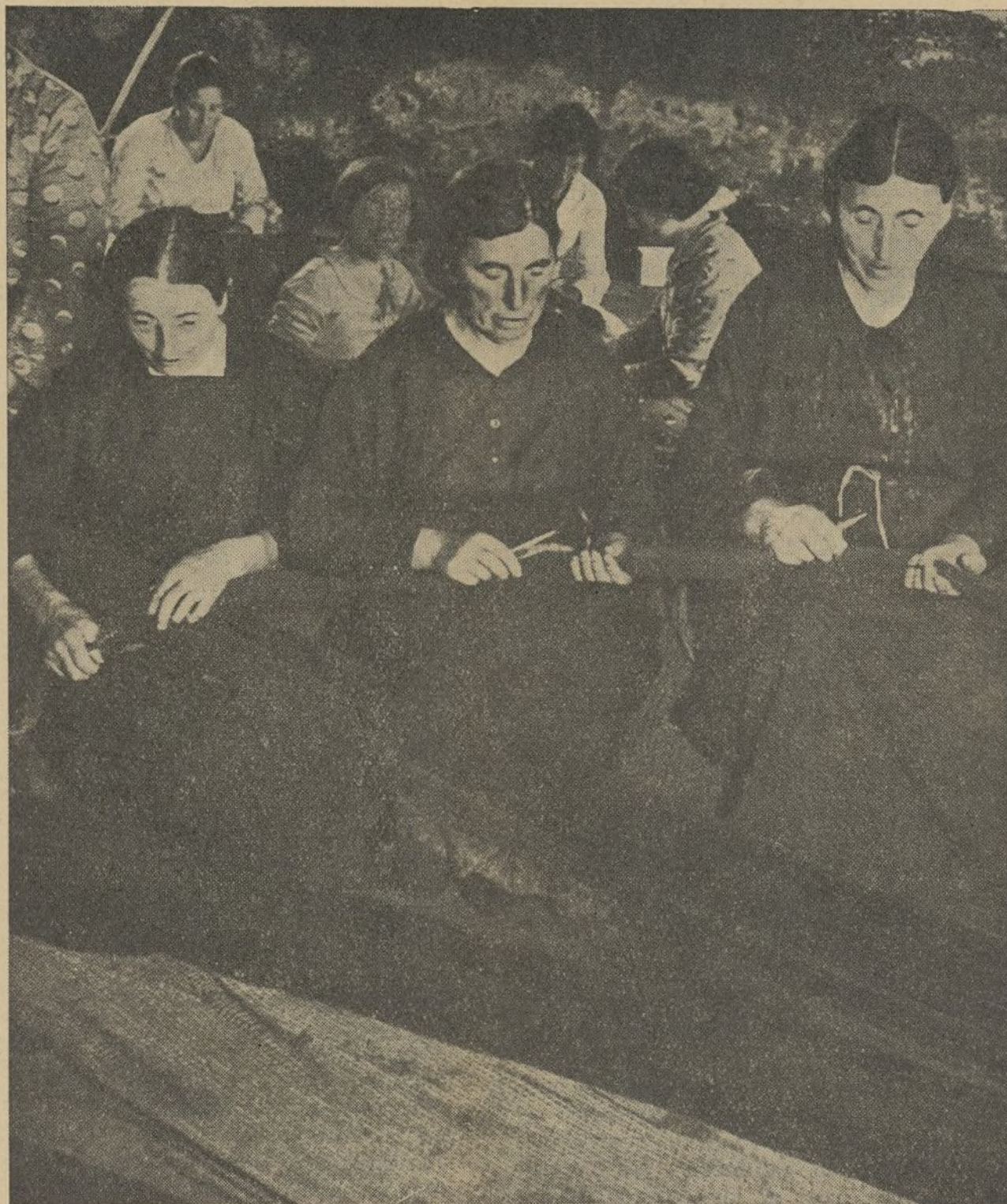
Loito e door na nosa terra. As mulleres dos mariñeiros asesinados pol-o feixismo coidan os aparellos, na espera da volta dos seus fillos c-ô trunfo do pobo.

FLERIDA FLORES ARTIFICIALES Y NATURALES ESPECIALIDAD EN CORONAS Y ADORNOS DE TEATRO CALLE DE LA CRUZ, 10