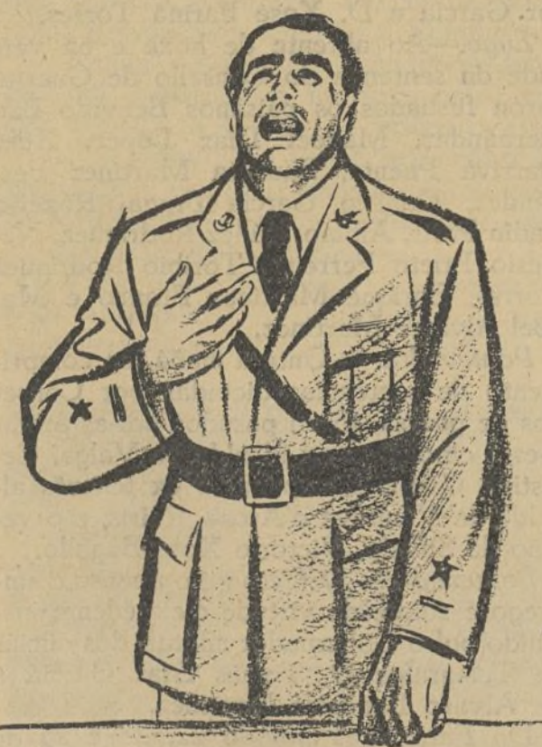
El camarada Líster en un momento de su intervención en el acto organizado por el Comité de Barriada de la zona Este. (Apunte del natural, por Briones.)

Habla de las mujeres de los pueblos de Toledo, las cuales lloraban cuando la 11 División se marchaba de aquéllos, por-