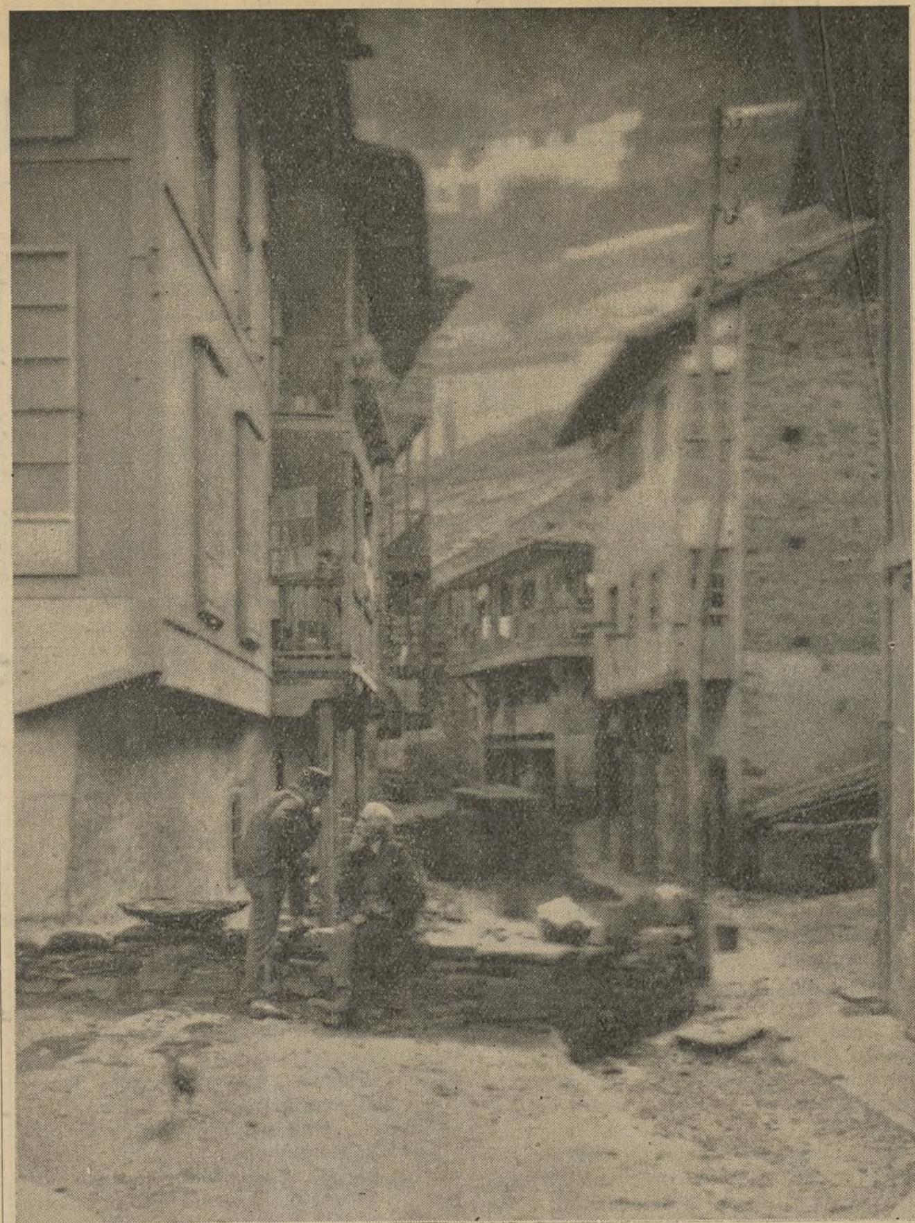
Esta rua—chea de tristura—d-un pobo de Galiza, espella todo o terror c-os feixistas espallaron pol-a nosa terra.

Denantes da treición d-os militares per-xuros, cando o sangue republicán inda non fora derramada a torrentes pol-os pobos galegos, cando o pé d-os Cruceiros de to-dol-os camiños non s-atopaban ainda, en al-bores tráxicos, montóns de cadavres cheos de tiros, a figura exótica d-aquel negro-mestizo levaba ás xentes de Bergantiños unha extrana curiosidade... Os nenos con-tempraban aparvados suas cadeas d-ouro cheas de dices e amuletos, suas sortixas re-brilantes de pedrería, seus alfileres suxetos