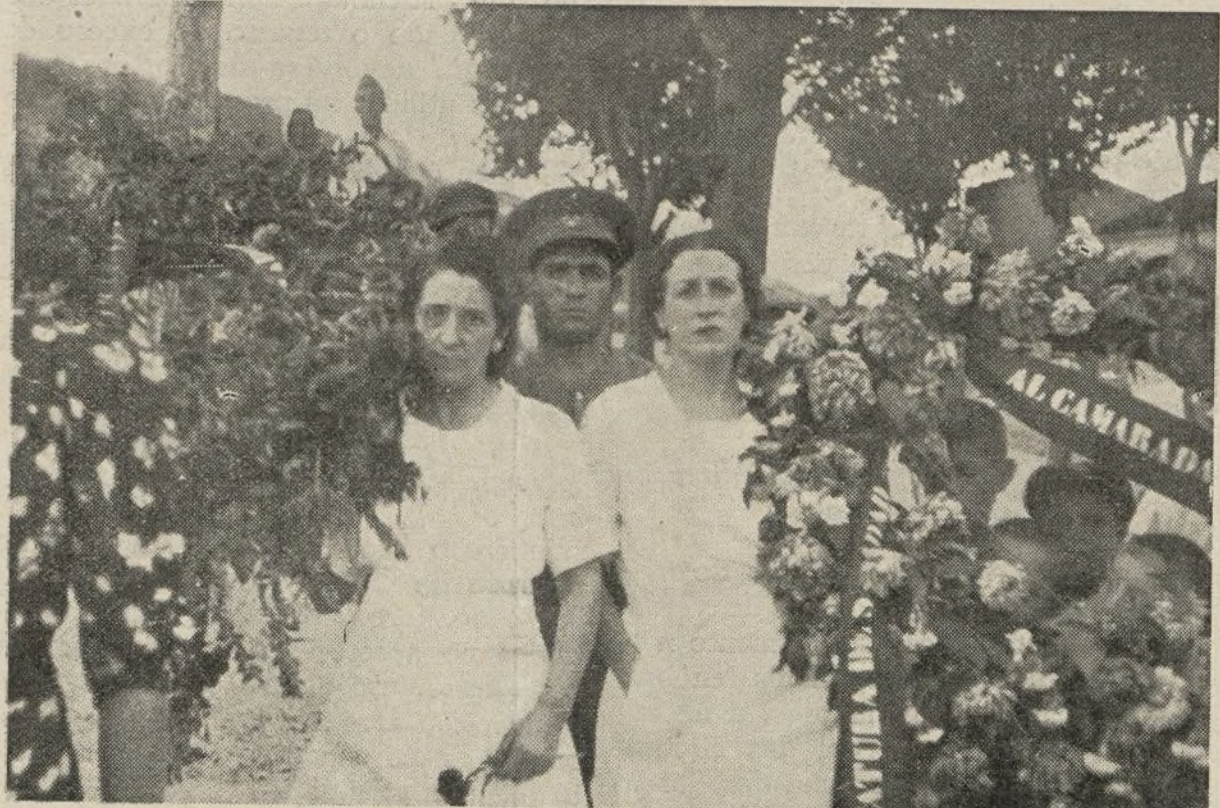
Estas flores cubrirán la tumba del que fué glorioso jefe de nuestro Ejército popular...

NUEVA GALICIA quiso también rendir a este héroe su postrera admira-