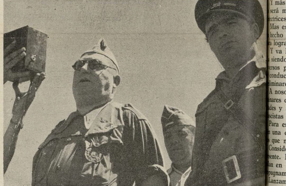
También el defensor de Madrid habló a los combatientes.

vosotros, me negué a otro plan había trazado. Desde el 7 de mayo, bre lucháis a mis órdenes y si os habéis cubierto de gloria. Un la guerra es el espíritu. Un zón y un espíritu, y el pueblo. El pueblo ruso también venció sin apenas elementos de combate. Vosotros tenéis que recorrer toda paña de extremo a extremo dem-