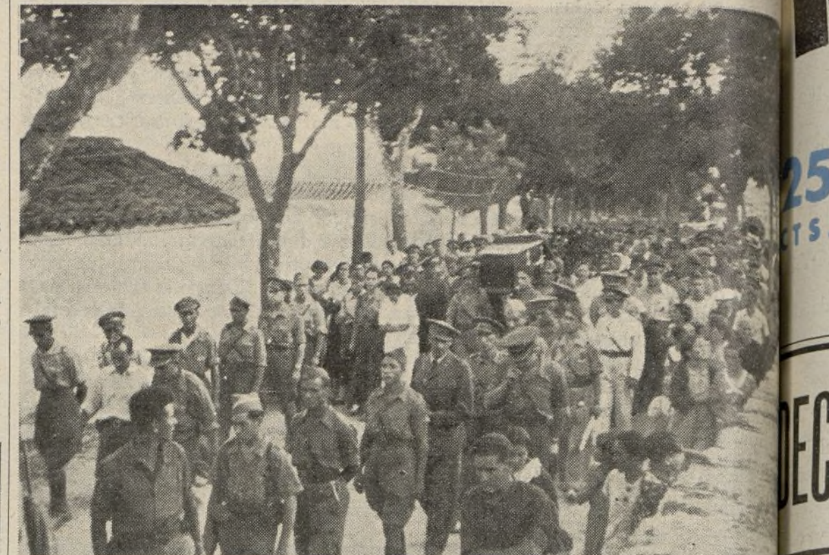
Soldados, mujeres y obreros acompañan en su última marcha al valiente comandante Pando...

ciar cuán querido era Pando. Todos rivalizan en darle guardia, llevándose ésta por un riguroso orden.