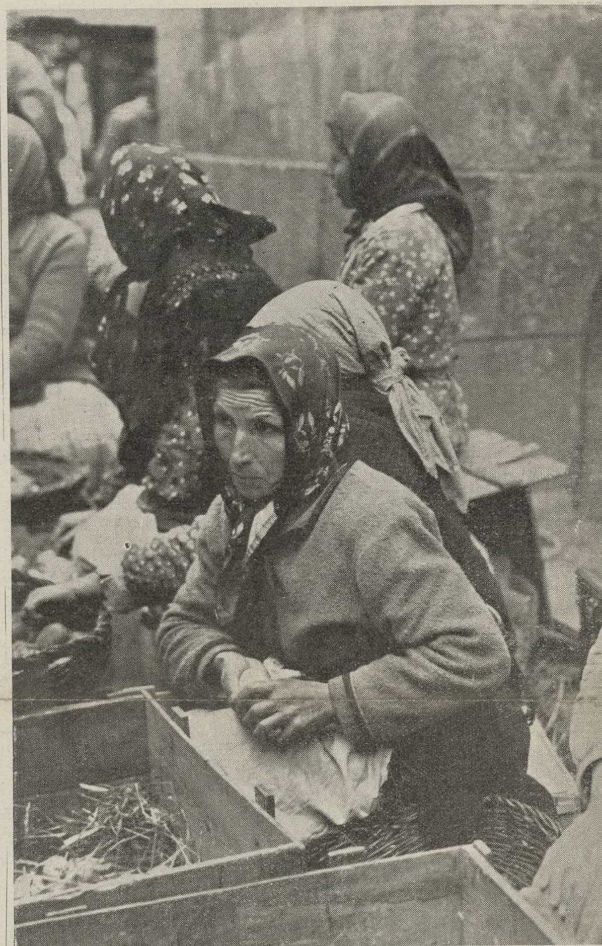
On te alongaban a nosa Terra co seu traballo. Oxe, estas mulleres labouren a forza pra tapal-a fame dos treidores...