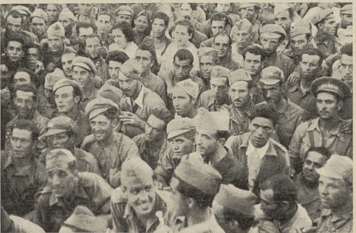
Un grupo de soldados escucha atentamente...

"Camaradas: Un sentimiento de orgullo indecible me domina hoy al ve-