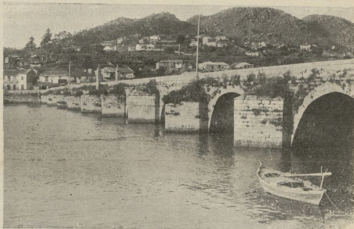
A ponte de Sampayo. Sobor d-ela os nosos irmáns do século derradeiro nicaron as forzas invasoras napoleónicas. Xunto a ela tamén caerán agora os treidores que invaden a Hespaña.