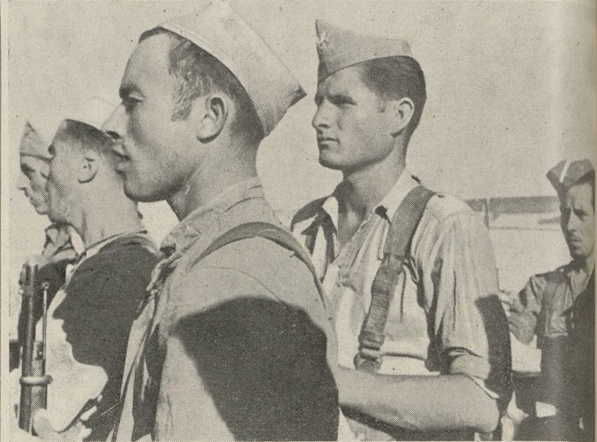
En los rostros, curtidos por cien batallas, de estos hermanos se adivina el porvenir de España y de Galicia...

gonesa. Muchos de estos evadidos eran hijos de la Galicia avasallada por las tropas alemanas de ocupación. De Orense, de Lugo, de Pontevedra... aquí bastantes—y de la Coruña... Todos ellos nos manifestaron, aquella noche que los encontramos en medio de estos campos del oriente de España,