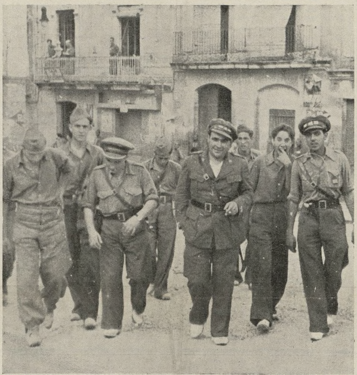
Jefes queridos, hijos del pueblo, que llevan a nuestros soldados hacia la victoria...

Y a la hora de valorar conductas hemos de fijarnos principalmente en la muy ejemplar que los combatientes gallegos, los obreros y los campesinos de la tierra mártir de Galicia, han venido observando desde el instante mismo en que empuñaron las armas para comba-