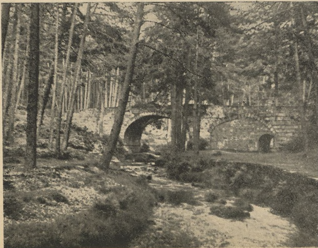
Pontes d'ensoño n'a paz idilica d'os piñeirales. (Os verdugos de "falange", escollen istes paixases fermosos pra asesinar a os nosos irmans.)

Que non se alarmen certos "internacionalistas" de dublé. Pol-o camiño da variedade pode chegarse primeiro ao internacionalismo d-un idioma que pol-a competencia d-unhas cantas linguas que aspiran á hexemonía cultural do mundo. Os anxeios de renovación que arestora se sinten con balbordes revolucionarios non se resolverán con amonencias monótonas senón con acordos maxestuosos. E a mesma lei que rixe o complicado movemento dos dous mundos rexirá a complicada armonía de todos os pobos da Terra.