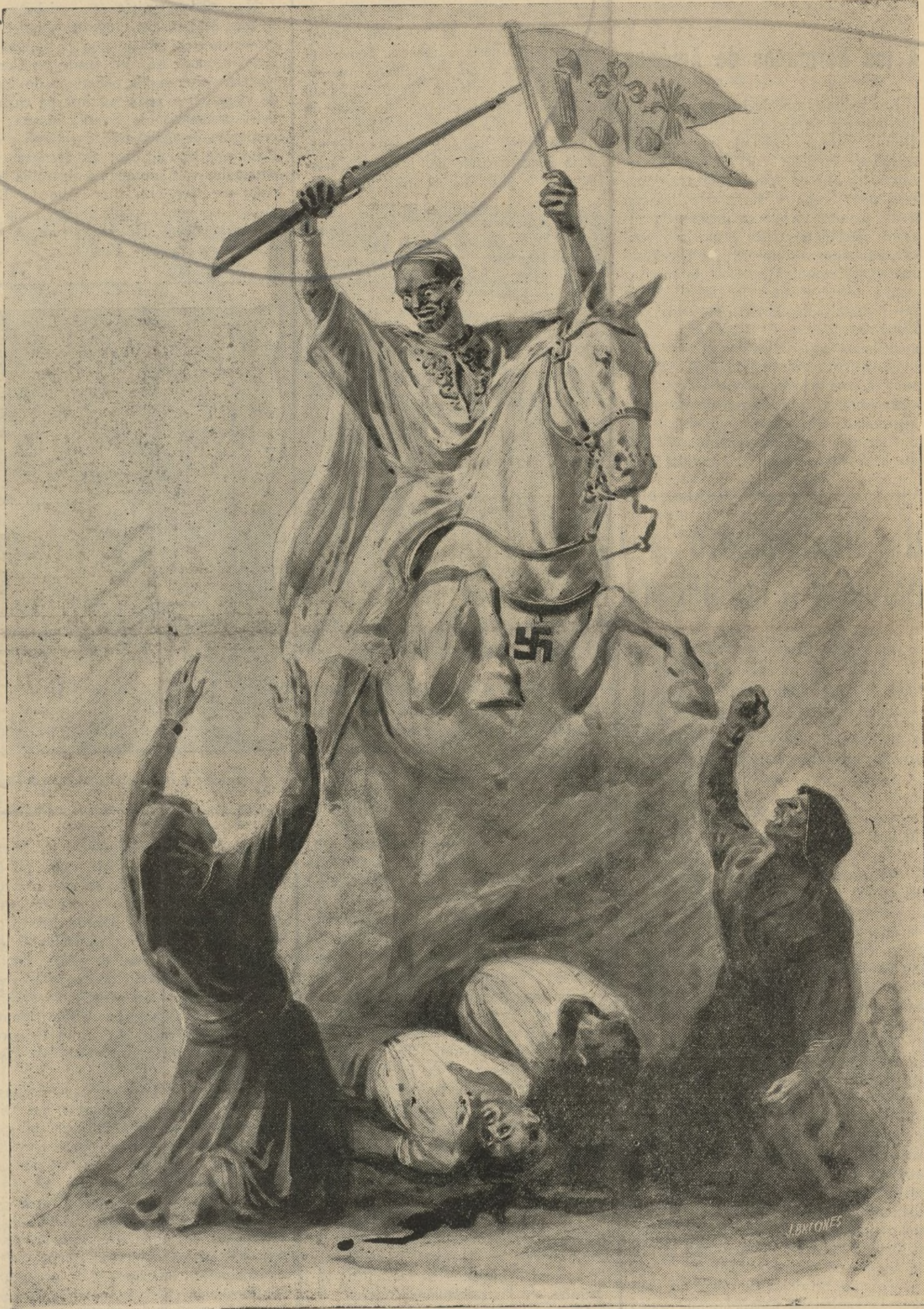
O Sant-Iago da Hespaña feixista

¡Que esta nuestra lección sea aprendida por quienes olvidaron que su obligación era desempeñar, como pueblos, un magisterio de amor, de paz y de comprensión entre los hombres de todos los países, misión que, aunque parezca paradójico, hay que defenderla a veces con la ofrenda de la propia vida!