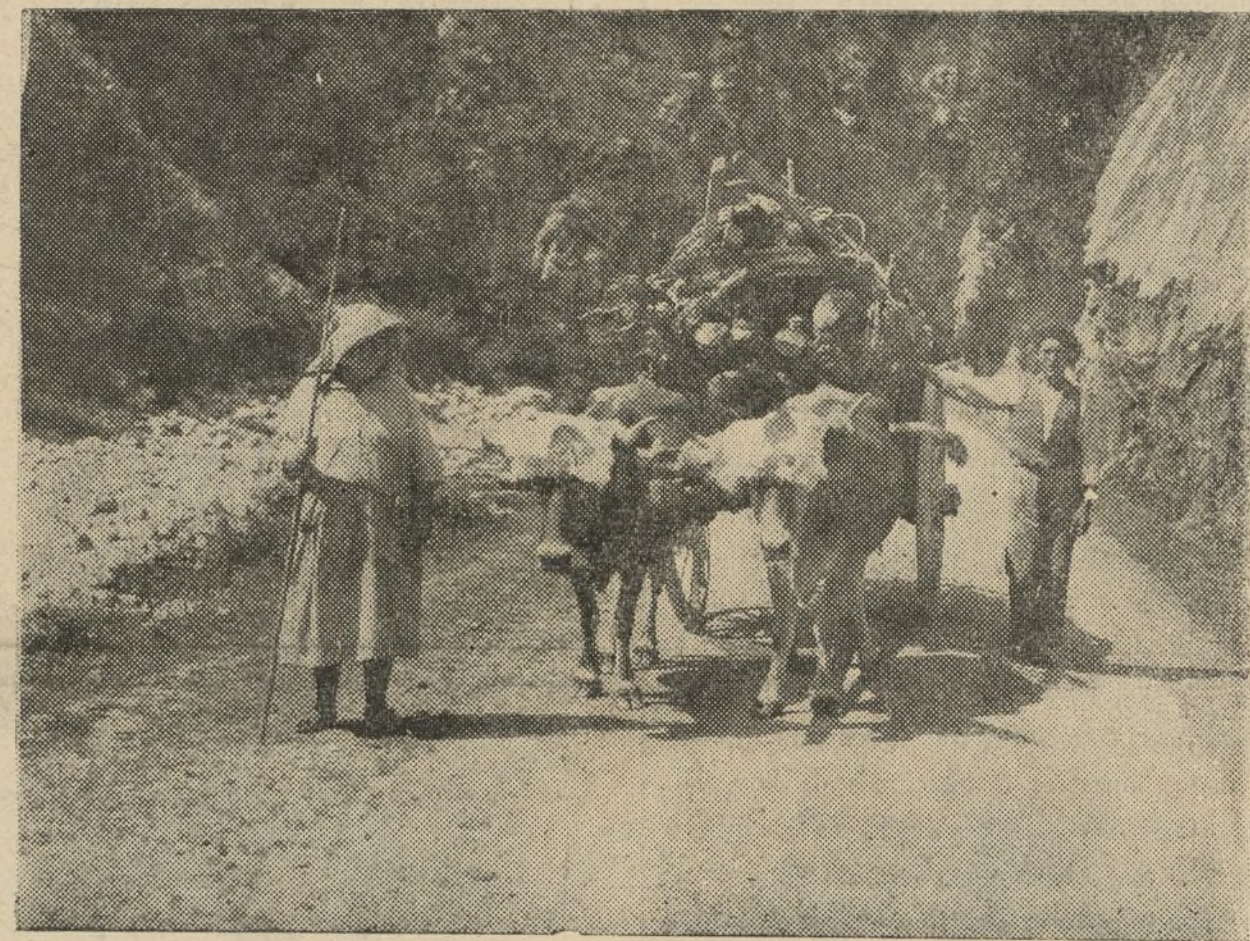
A muller e o filliño ocupan o lugar do ome asisiñado polos feixistas

Non podemos iste ano celebrar as Festas Maiores na augusta cidade de granítica. Iste ano, como o pasado e como o outro, non hai festas en Compostela. A maravilla policroma do fogo de vísperas; a festa sorrinte na carballeira milenaria de Santa Susana; a procesión devota diante das tumbas de Rosalía e de Brañas; as arengas espranzadas na Quintana; a algarabía popular na Ferradura e na Alameda. Todo iso no que o pobo galego puña a gracia suprema da súa canción a da súa danza, da súa ilusión e do seu