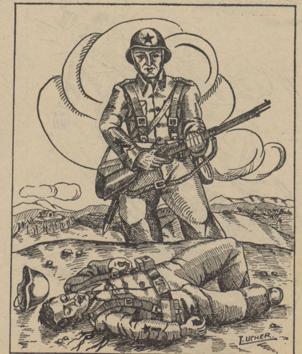
Nuestros hermanos caídos serán vengados

Después de resolver en esta primera reunión los diferentes aspectos de trabajo, el Comité Nacional saluda a todos los Comités y afiliados a la Liga, invitándoles a que sigan trabajando en bien de la Organización, como asimismo agradece todos los ofrecimientos que se han hecho por parte