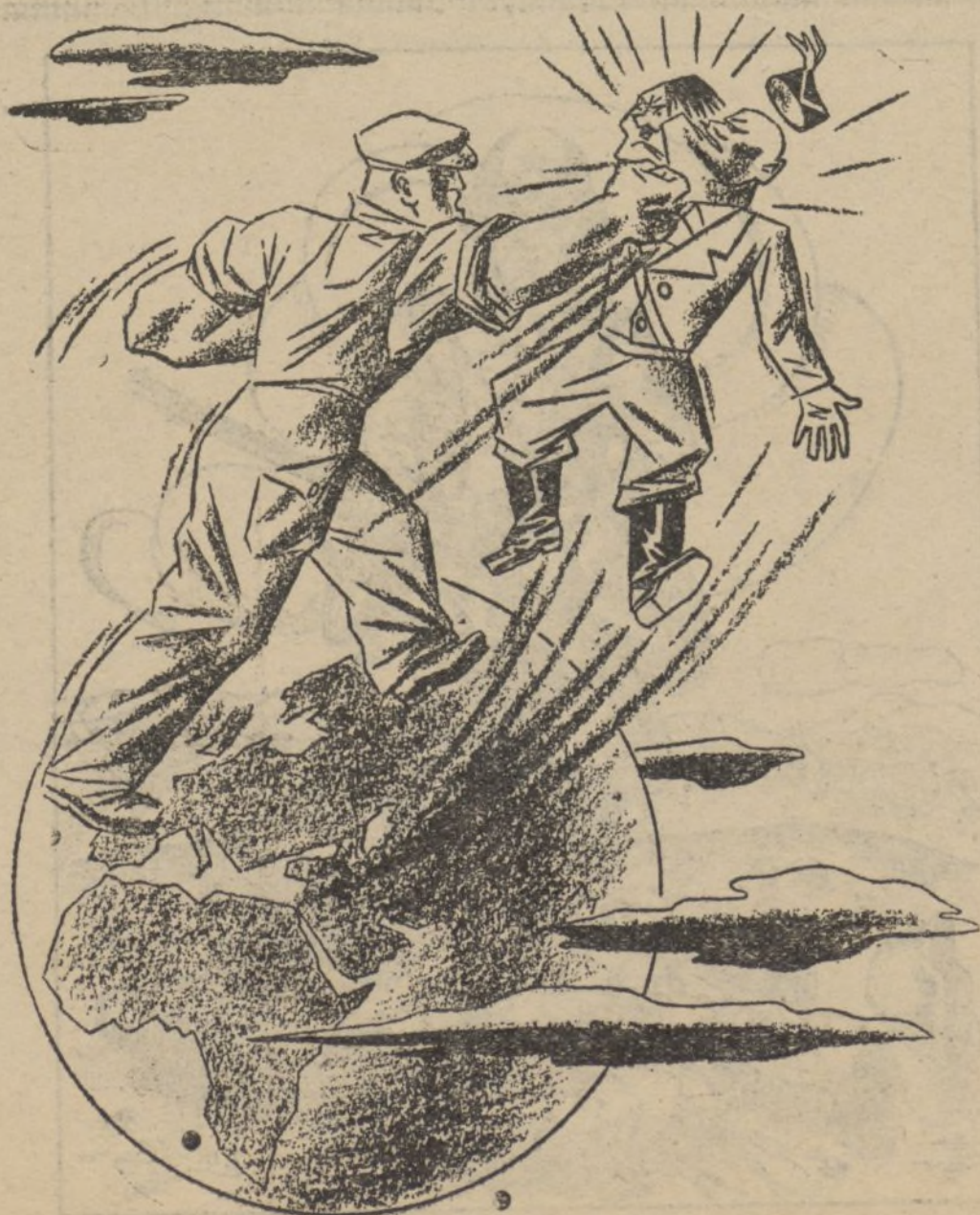
La respuesta que el fascismo necesita.

ta privada, en la que afirmaba que este imperio pertenecía a Italia. Es por esto por lo que Italia forma de Mallorca una base de operaciones para hacer el Mediterráneo suyo. Para ello se ha valido, engañando con falsas promesas de unos generales españoles que no dudaron en hacer traición a su patria. De no ser así, nosotros hubiéramos demostrado al asesino de nuestras mujeres e hijos que España, sin estar preparada para una guerra, no se deja arrebatar su suelo; pero, a pesar de esto, no le saldremos las cuentas a ese fanático tan bien como él piensa, puesto que los países interesados saben lo que esto supone y dejarán de complacerle en el robo de unas posiciones que servirían luego para combatir a las democracias.