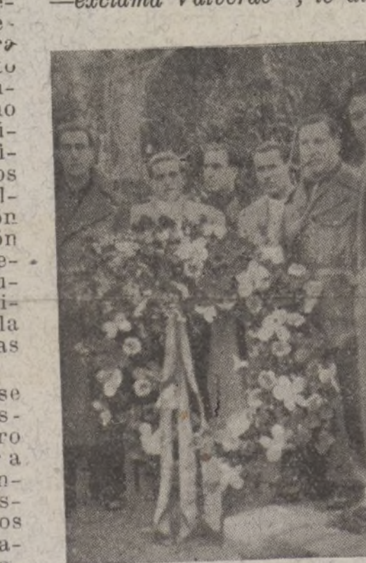
Corona depositada por nuestra Ejecutiva en el mausoleo de Pablo Iglesias en el XIII aniversario de su muerte.

—¡Si yo hablara con Azaña —exclama Valverde—, le diría