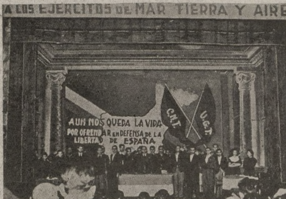
Presidencia del acto de Valencia

El gobernador termina su discurso entre muchos aplausos. Tras sus últimas palabras, las bandas del Batallón de Retaguardia interpretó el himno nacional, que fué escuchado respetuosamente por el público, con lo que se dió por terminado el acto.