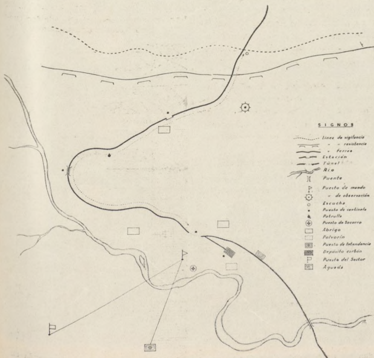
SUPUESTA BASE DE UN TREN BLINDADO