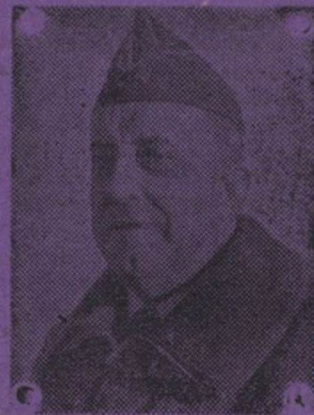
El General Pozas, glorioso jefe del pueblo