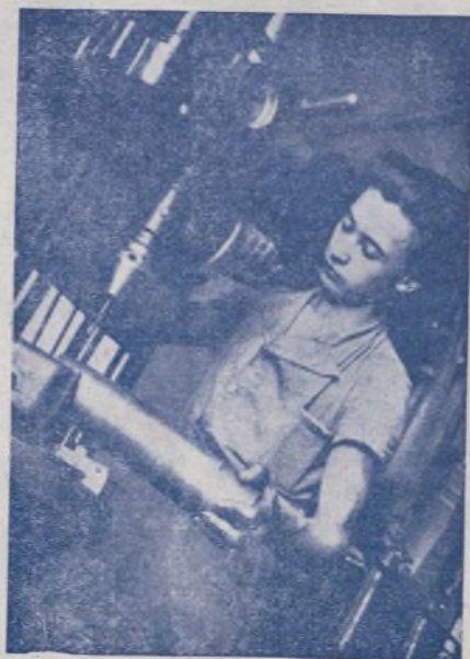
La juventud contribuye a ganar la guerra desde las fábricas

En los demás frentes, sin noticias de interés.