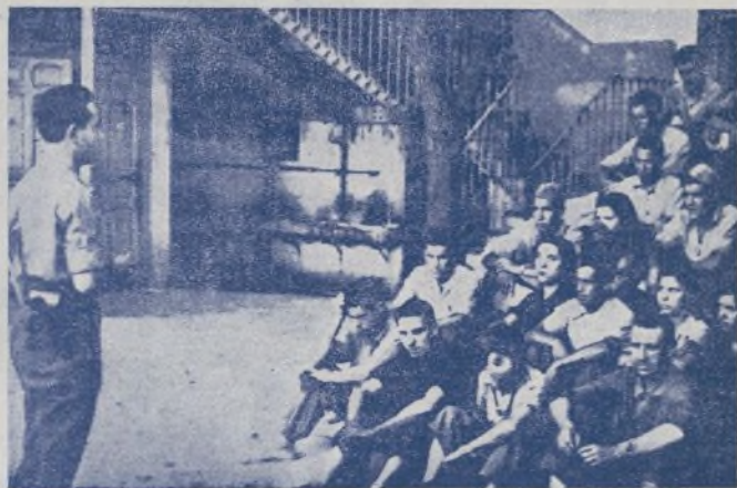
Obreros y soldados escuchando las palabras del Comisario de nuestra Brigada

En otro corrillo, frente a un torno, está el Comisario con un grupo de soldados y del responsable; al mismo tiempo se habla, y nos dicen que en los quince días de superproducción han aumentado un 35 por 100, que les ha valido, aparte de otras felicitaciones, un diploma de honor de la J. S. U., dedicado a la fábrica. El stajanovismo aquí es colectivo, y todos, por lo tanto, son stajanovistas. Dicen a Humanes la satisfacción que sienten por la visita hecha por los camaradas de la trinchera, y hacen