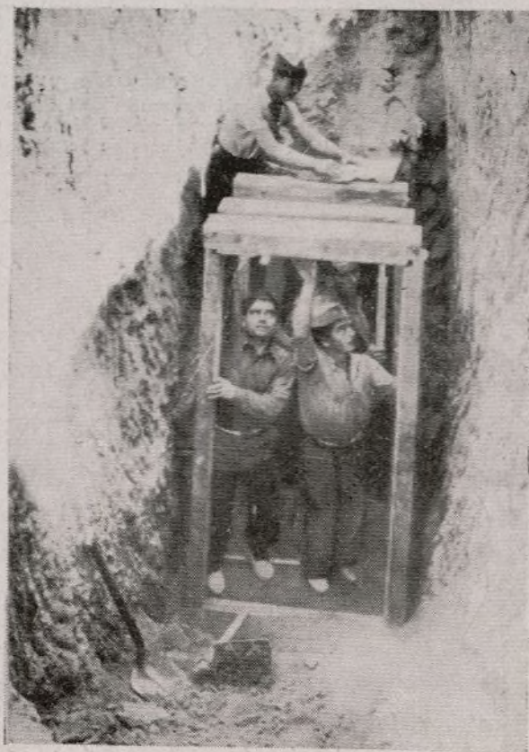
Todas las trincheras cubiertas

Las resoluciones de la reunión ampliada de Comisarios Activistas y Comisiones de Trabajo Social de nuestra Brigada han de llevarse a la práctica con toda rapidez y entusiasmo