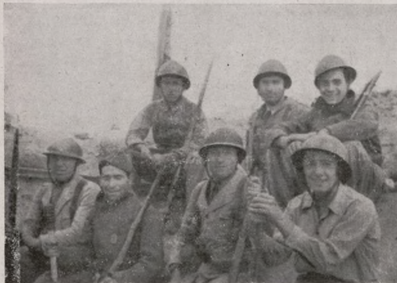
SOLDADOS DE LA 1.ª COMPAÑÍA, DEL 211

Publicamos en esta doble plana algunas fotos de camaradas que se distinguieron por su heroico comportamiento en el combate del día 27 y 28.