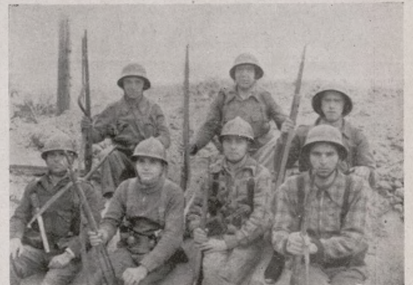
SOLDADOS DE LA 2.ª COMPAÑÍA, DEL 211

del 210, que luchó como los buenos, y fué herido, negándose a abandonar su puesto de combate, y allí siguió combatiendo hasta que, vuelto a ser herido, hubo que sacarlo a la fuerza; ya curado, ha vuelto a su puesto.