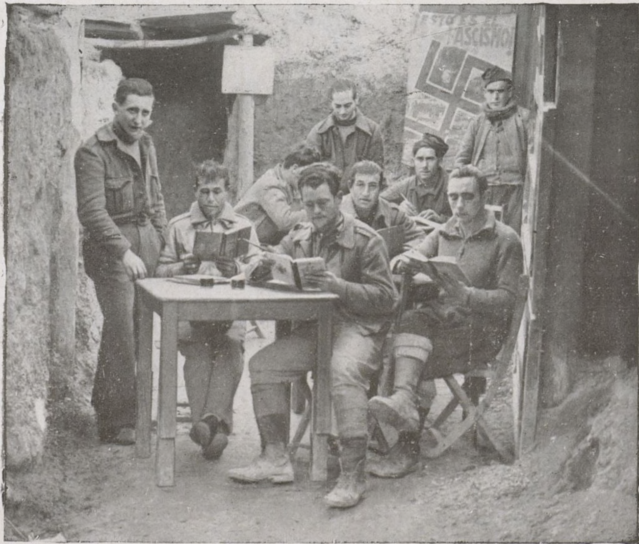
Una batalla ganada silenciosamente al enemigo, a muy pocos metros de él, por las camaradas del Batallón 209.