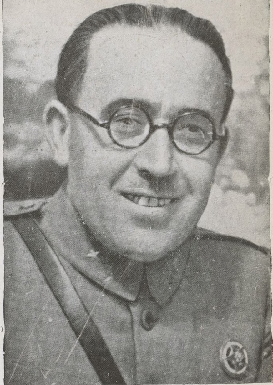
El heroico General Rojo, gran cerebro de nuestro Ejército y de la victoria de Teruel

¡Viva el Gobierno del Frente Popular! ¡Viva el Ejército popular de la República!