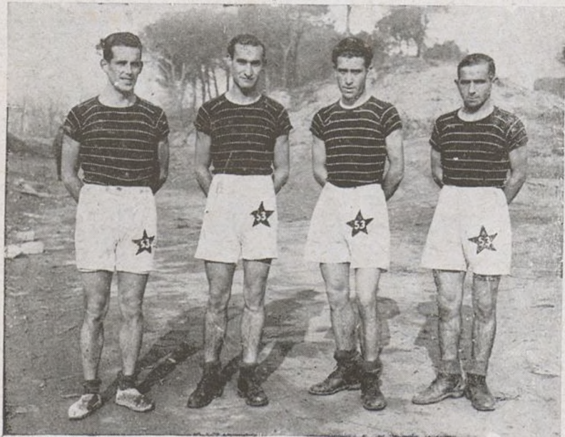
Corredores de nuestra Brigada que participaron en el Trofeo Año Nuevo