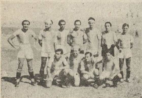
Equipo de Artes Gráficas del Ministerio de la Guerra.

El sábado pasado se celebró en un campo de deportes un encuentro de fútbol entre los equipos del 210 Batallón de nuestra Brigada y el Artes Gráficas del Ministerio de la Guerra.