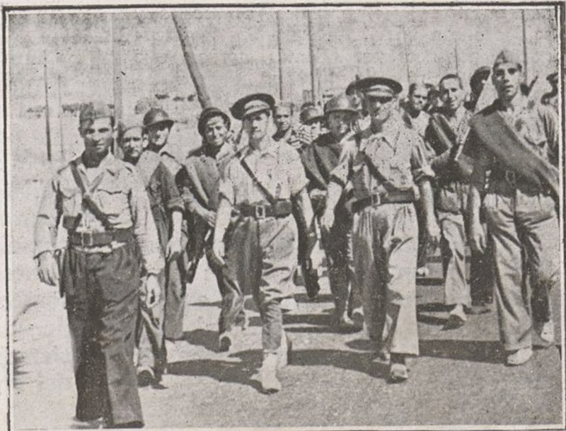
Nuestros soldados regresan sonrientes después de realizar los ejercicios militares que ordena el mando.