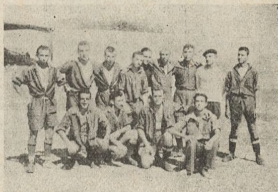
Equipo del 210, ganador de la copa.

Estos encuentros con los trabajadores de nuestras industrias de guerra, deben intensificarse, pues no sólo dan auge al deporte, sino que ligan muy fuerte nuestros dos frentes de lucha: "la trinchera" y "la fábrica".