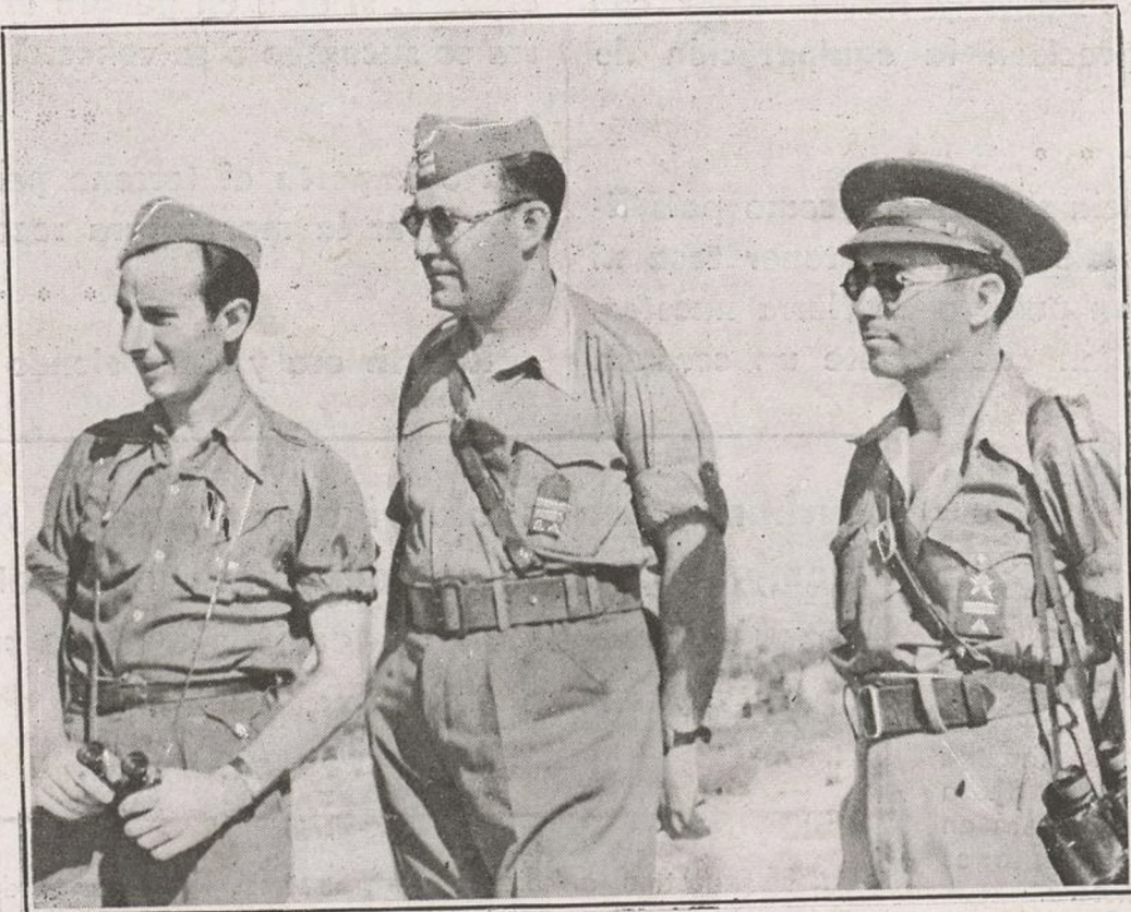
Nuestros Jefes asisten a los ejercicios realizados, siempre pendientes de los soldados.

Esperamos que los restantes Batallones de nuestra Brigada sabrán aprovechar el tiempo, sobre todo en la cuestión militar, como lo ha hecho con acierto el 209.