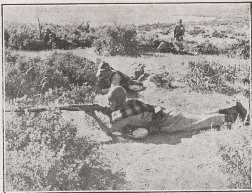
Dos momentos de los ejercicios realizados por el 209

No ha perdido el tiempo mientras ha estado de descanso el Batallón 209. Al contrario, ha sabido aprovechar los días, como deben aprovecharse. El descanso no sólo debe ser motivo de diversión sino que debe de trabajarse en ir ha-