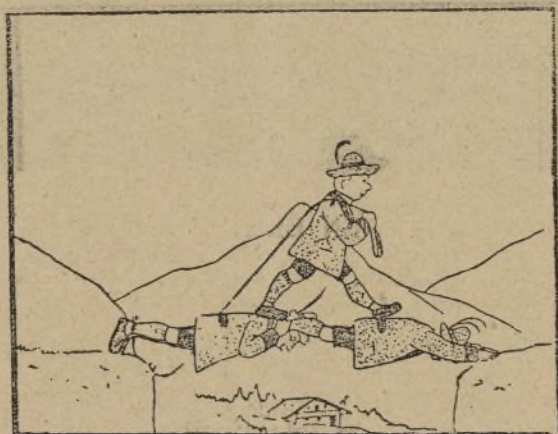
3.— Pasando uno al otro lado.