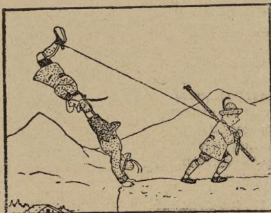
4.— Y con maña pasó los compañeros.