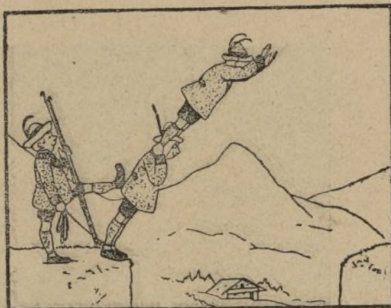
2.— Y acto seguido hicieron el ensayo.