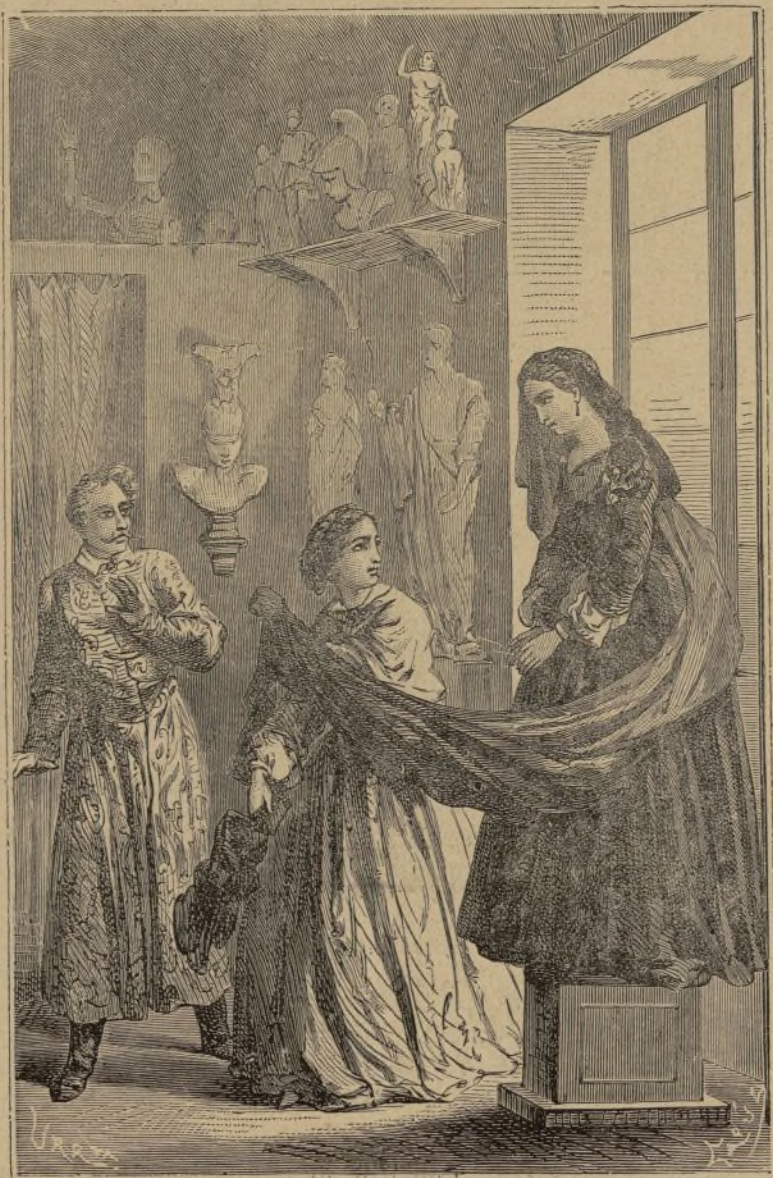
LA POLÍTICA ACTUAL