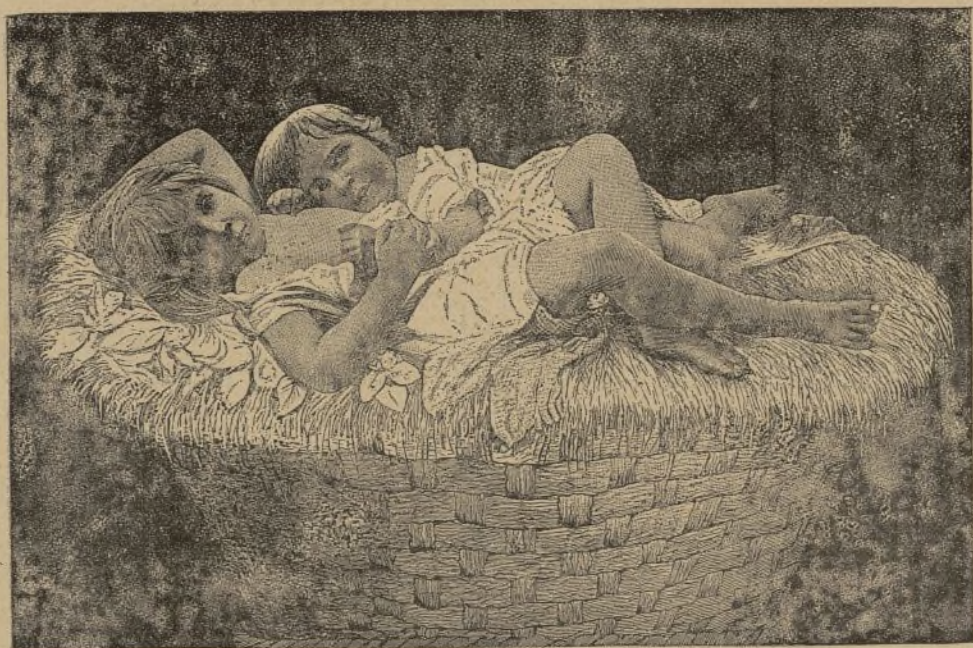
EN EL NIDO