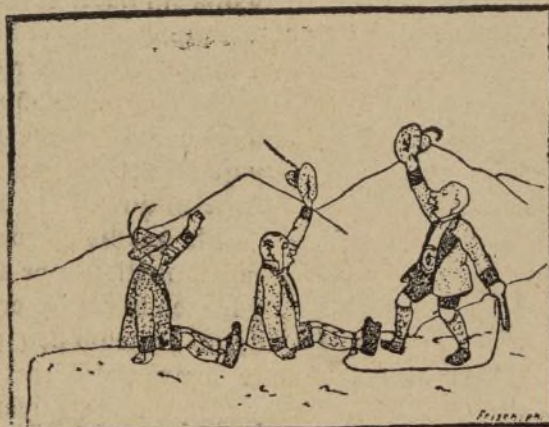
5.— Que dieron un viva á la...