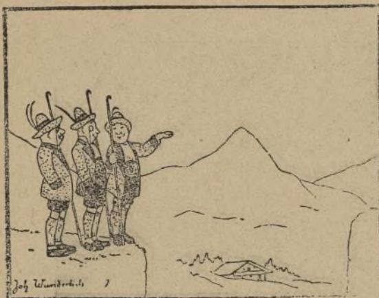
1.— Pasar urge; pongamos en práctica nuestra idea.